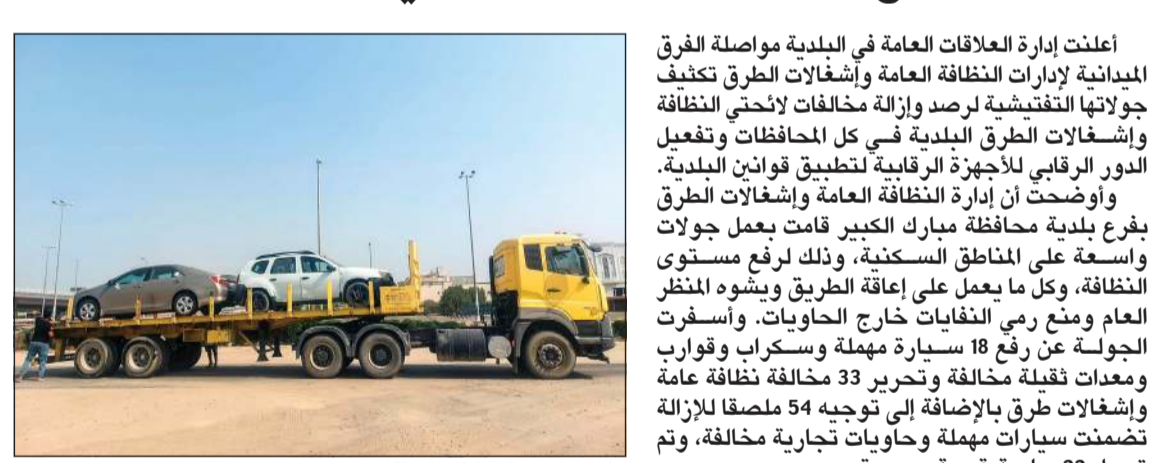
جانب من رفع السيارات المهمة