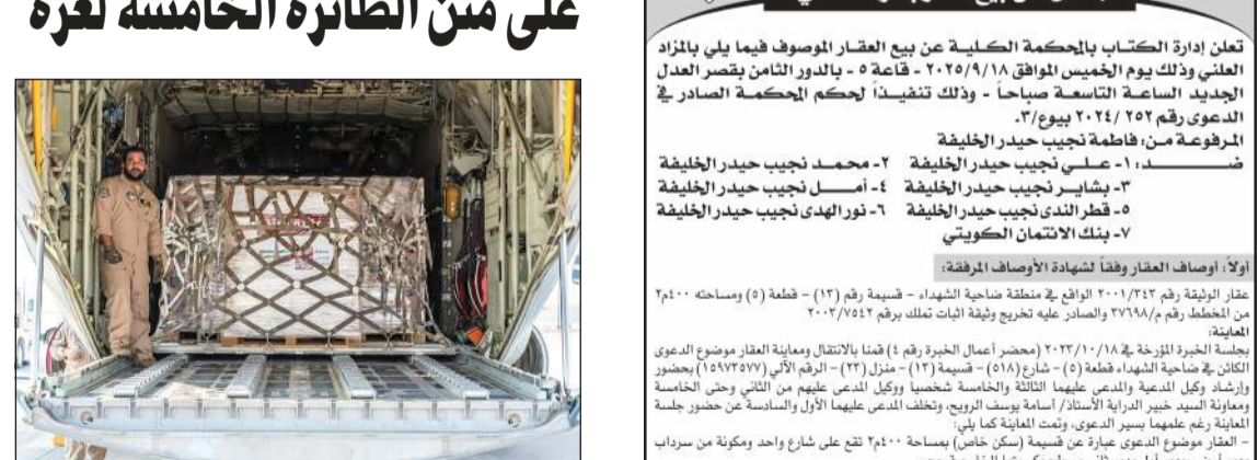
طاقم الفتي يشرف على نقل المساعدات إلى الطائرة الخامسة

«كونا»: وصلت أسس الطائرة الإغاثية الخامسة من الجسر الجوي الكويتي الثاني إلى مطار «ماركا» العسكري في الأردن محملة بـ 10 أطنان من المساعدات الغذائية تمهيداً لإيصالها إلى الأشقاء في قطاع غزة. وتأتي هذه الرحلة بتنظيم من جمعية الهلال الأحمر الكويتية وبالتنسيق مع وزارات الشؤون الاجتماعية والأخرى الخارجية والدفاع ممثلة بالقوة الجوية الكويتية. وأكد الأمين العام في الهلال الأحمر الكويتية فهد المنديل لـ «كونا» قبيل الإقلاع تضامن الكويت مع الأشقاء في قطاع غزة، مشدداً على عزم الجمعية مواصلة تقديم المساعدات بشكل عاجل بغية سد الحاجة الملحة والضرورية لمتطلبات الحياة الأساسية هناك، وأضاف المنديل أن هذه الطائرة الإغاثية الخامسة من الجسر الجوي الثاني تأتي لتلبية للتوجهات السامية من القيادة الحكيمة للبلاد تجسيدا لموقف الكويت الثابت في نصرة الأشقاء الفلسطينيين والوقوف إلى جانبهم في هذه الظروف الإنسانية العصبية.