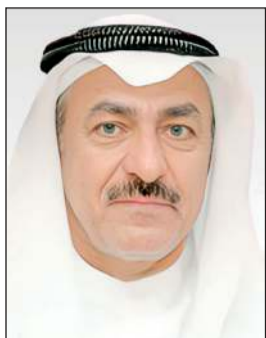
المستشار علي الضبيبي

القرارات المعمول بها. وبين أن عمل اللجنة لا يقتصر على الاجتماعات الأسبوعية فقط فهناك أمانة سر بها عاملون يقومون بمتابعة جميع التظلمات المقدمة خلال الأسبوع وتفرغ البيانات كاملة وإعداد الدراسات القانونية الخاصة بها تمهيداً لرفعها إلى اللجنة للتصويت عليها في الجلسات. وأكد استمرار اللجنة بتلقي التظلمات على مدار 24 ساعة وطوال أيام الأسبوع بما في ذلك أيام العطل الرسمية. وأوضح أن «من وسّحت منهم الجنسية والتي حصلوا عليها طبقاً للمادة الثامنة