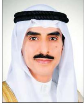
الشيخ ثامر جابر الأحمد