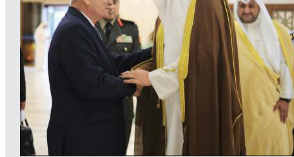
وزير الدفاع الشيخ عبدالله العلي مودعاً وزير الدفاع الوطني اللبناني اللواء طيار ميشال منسى

كونا: غادر البلاد وزير الدفاع الوطني للجمهورية اللبنانية الشقيقة اللواء طيار ميشال منسى، وذلك عقب زيارته الرسمية للبلاد. وذكرت وزارة الدفاع في بيان صحفي أنه كان في وداعه على أرض المطار وزير الدفاع الشيخ عبدالله العلي، حيث أعرب عن اعتزازه بهذه الزيارة وما عكسته من عمق العلاقات الأخوية الراسخة بين البلدين الشقيقين. حضر وداعه وكيل وزارة الدفاع الشيخ د. عبدالله المشعل، ونائب رئيس الأركان العامة للجيش اللواء الركن طيار الشيخ صباح جابر الأحمد، وعدد من كبار الضباط القادة بالجيش.