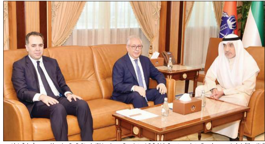
النائب الأول لرئيس مجلس الوزراء وزير الداخلية الشيخ فهد اليوسف خلال استقباله السفير المصري أسامة شلتوت

(كونا): استقبل النائب الأول لرئيس مجلس الوزراء وزير الداخلية الشيخ فهد اليوسف سفير جمهورية مصر العربية الشقيقة لدى الكويت أسامة شلتوت، وذلك بمناسبة قرب انتهاء فترة عمله سفيراً لبلاد. وأشاد الشيخ فهد اليوسف وفق بيان صحفي صادر عن وزارة الداخلية بالجهود المتميزة التي بذلها السفير شلتوت خلال فترة عمله وما قدمه من إسهامات بارزة في سبيل تعزيز أواصر العلاقات الأخوية المتينة التي تجمع الكويت وجمهورية مصر العربية، متمنياً له دوام التوفيق والنجاح في مهامه