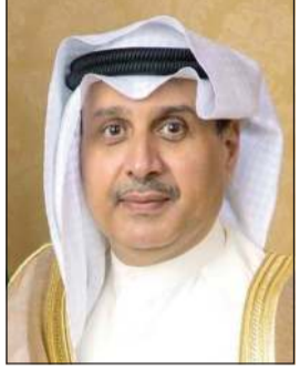
الشيخ حمد جابر العلي

صدرت مراسيم أميرية بتعيين وزير شؤون الديوان الأميري، ووكيل الديوان، ورئيس ديوان سمو ولي العهد، حيث صدر مرسوم أميري بتعيين الشيخ حمد جابر العلي الصباح وزيراً لشؤون الديوان الأميري بدرجة وزير اعتباراً من 1 سبتمبر 2025.