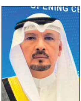
سفيرنا لدى الصين جاسم الناجم

أطلقت سلسلة من المبادرات والمشاريع الطموحة في هذا المجال بالتعاون مع الصين. وأوضح أن الكويت أطلقت العديد من المشاريع مع الصين مثل مشروع الشقاييا للطاقات المتجددة ومبادرة الكويت الرقمية 2035 إضافة إلى مشروع معهد الأبحاث لتحلية المياه والطاقة ومعالجة النفايات ومشروع الجوامع الاصطناعي لجامعة الكويت وإنشاء مختبرات متخصصة لدعم تطوير المدن الذكية، معتبراً أن هذه المشاريع تجسد التزام الكويت الجاد بالتحول نحو اقتصاد المعرفة وتعكس روح التعاون مع الصين.