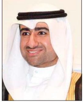
الشيخ عبدالعزيز مشعل المبارك