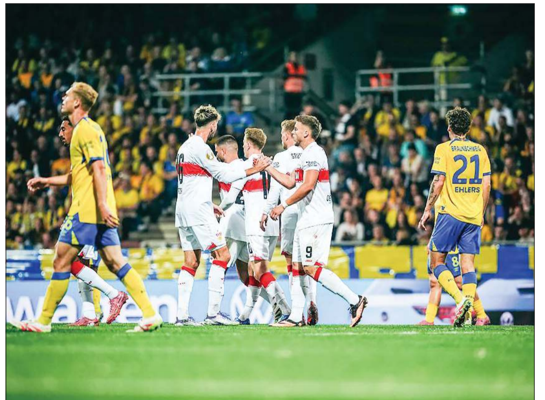
قرعة لاعبي شتوتغارت بالتأهل إلى الدور الثاني بكأس ألمانيا