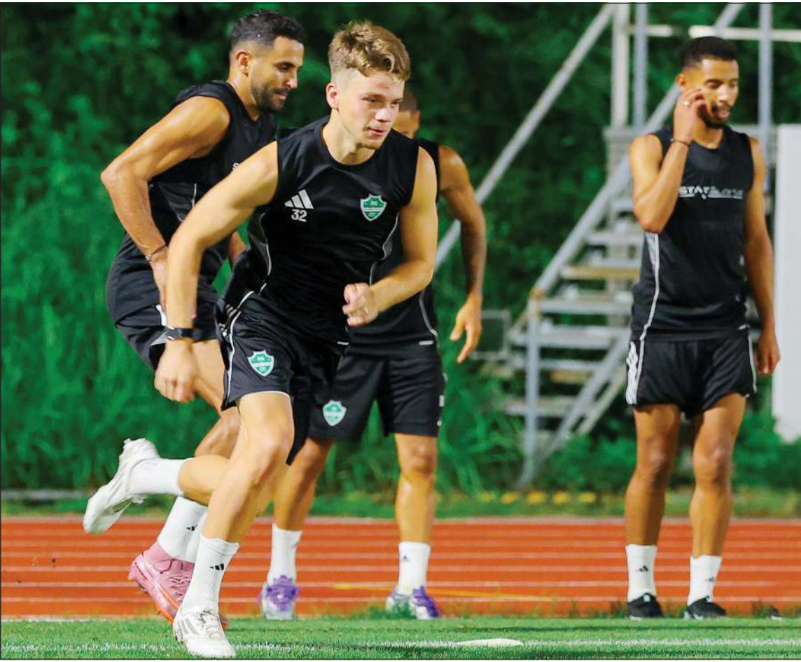
الأهلي أكمل تحضيراته لمواجهة نيوم في انطلاق الدوري السعودي

تجاوز خسارته في نصف نهائي «كأس السوبر» أمام النصر ومصالحه جماهيره التي أبدت امتعاضها من نتائج الفريق في المباريات الودية. أقام بطل الثنائية بقيادة مدربه الفرنسي لوران بلان معسكراً في إسبانيا ثم البرتغال خاض خلاله 5 مباريات. ورغم احتفاظ الاتحاد بجميع عناصره الأجنبية وعلى رأسها أفضل لاعب في الموسم الفرنسي كريم بنزيمة فإنه بعد الخسارة من النصر بدأت تحركات الإدارة لإبرام بعض الصفقات الأجنبية لدعم خط الوسط. ويعول الهلال الذي يستقبل جاره الرياض الجمعة على مشاركته الصيفية المميزة في مونديال الأندية في الولايات المتحدة حيث تعادل مع ريال مدريد الإسباني وتغلب على مان سيتي الإنجليزي ليبلغ الدور ربع النهائي، كي يستعيد لقب الدوري الذي أحرزه 19 مرة قياسية. وتعاقد مع المدرب الإيطالي