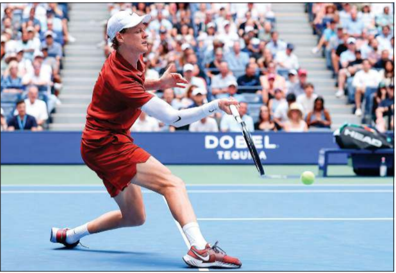
يانيك سينر فاز بسهولة في أولى مبارياته في «أميركا المفتوحة» للتنس

ولدى السيدات، حسمت شفيونتيك، المصنفة ثانية وبطلة نسخة 2022، مباراتها أمام الكولومبية إيميلىانا أرانغو 6-1 و6-2 في ساعة ودقيقة واحدة فقط من اللعب. وتواجه البالغة 24 عاماً، في الدور الثاني الهولندية سوزان لامينس الفائزة على الأميركية فاليري غلوزمان 6-4 و6-2. وخلافاً لشفيونتيك، عانت الأميركية كوكو غوف الثالثة وبطلة 2023 لحجز بطاقتها إلى الدور الثاني للمرة السادسة في سبع مشاركات لآلته الـ 21 عاماً التي توجت هذا الموسم بطلة لورلان غاروس في ثاني ألقابها ضمن البطولات الكبرى، بفوزها على الأسترالية أليا تومليانوفيتش 6-4 و6-2 (7-2) و7-5 بعد لقاء استغرق أقل من ثلاث ساعات بثلاث دقائق.