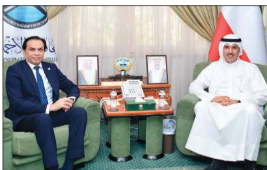
محافظ الأحمد والشيخ حمود جابر الأحمد مستقبلا سفير باكستان ظفر إقبال

استقبل محافظ الأحمد والشيخ حمود جابر الأحمد مستقبلا سفير باكستان ظفر إقبال، حيث جرى التعارف وتبادل الأحاديث الودية التي تناولت العلاقات الثنائية بين البلدين وسبل تعزيزها في جميع المجالات، كما رحب المحافظ بالسفير، متمنيا له التوفيق في مهام عمله والدفع بعلاقات البلدين إلى آفاق أرحب.