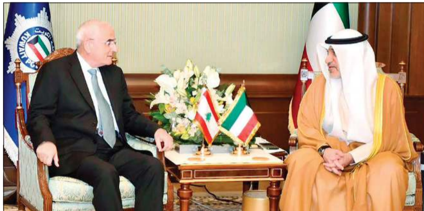
النائب الأول لرئيس مجلس الوزراء وزير الداخلية الشيخ فهد اليوسف مستقبلا وزير الدفاع الوطني للجمهورية اللبنانية اللواء الركن طيار ميشال منسى

كونا: بحث النائب الأول لرئيس مجلس الوزراء وزير الداخلية الشيخ فهد اليوسف فهد اليوسف مع وزير الدفاع الوطني للجمهورية اللبنانية الشقيقة اللواء الركن طيار ميشال منسى أوجه التعاون المشترك وسبل تفعيله بما يخدم المصالح المشتركة ويعزز الأمن والاستقرار في المنطقة. جاء ذلك في بيان صحفي صادر عن وزارة الداخلية عقب استقبال الشيخ فهد اليوسف وزير الدفاع الوطني اللبناني والوفد المرافق له، وذلك في إطار زيارته الرسمية إلى الكويت.