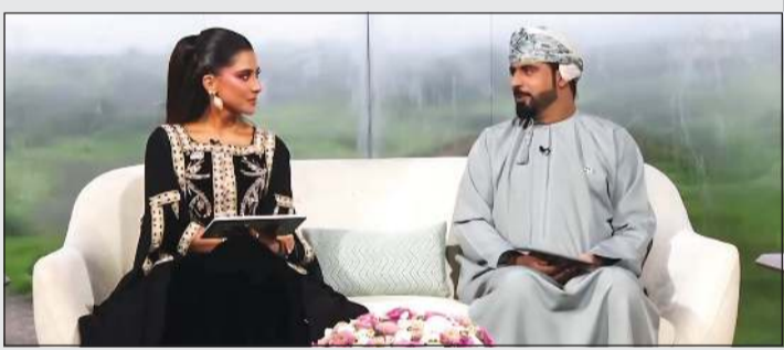
حصلة اللوغاني مع سيف الفوري في حلقة البرنامج أمس