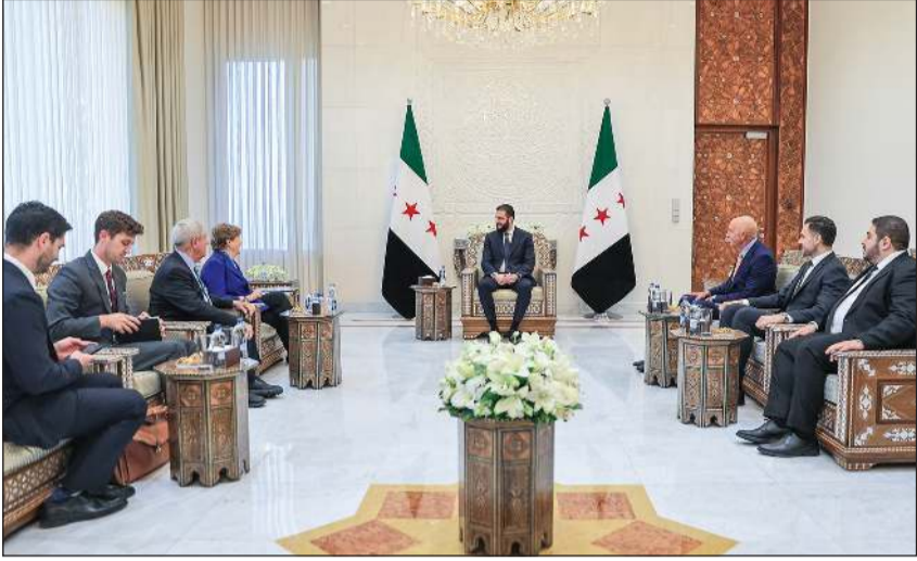
الرئيس السوري أحمد الشرح مستقبلاً وفد الكونغرس الأميركي

عواصم - وكالات: أكد التحالف السوري - الأميركي من أجل السلام والأزدهار، أن زيارة الوفد الأميركي رفيع المستوى إلى سورية تشكل «خطوة محورية في الجهود المبذولة لرفع العقوبات، ودعم تعافي سورية». وقال التحالف في بيان نشره على منصة إكس: «إن هذه الزيارة تفتح الباب أمام انخراط إيجابي للولايات المتحدة في مسار البناء والاستقرار في سورية»، معرباً عن الأمتنان العميق للسيناتور جين شاهين، وذلك لاستماعها إلى صوت الجالية السورية الأميركية، واعترافها بأهمية معالجة ملف العقوبات الذي يمس حياة الشعب السوري.