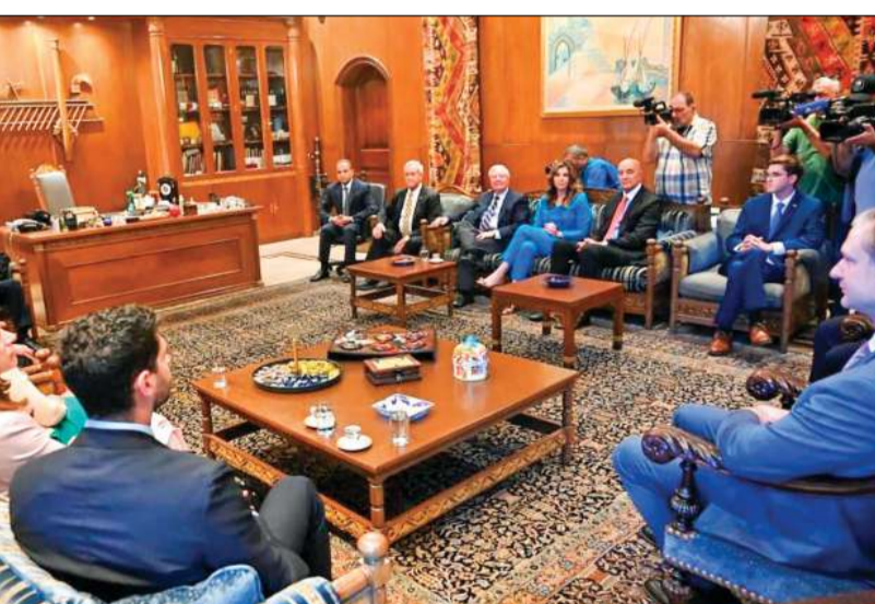
رئيس مجلس النواب نبيه بري مستقبلاً الوفد الأميركي في عين التينة

أما العضوة الأخرى في الوفد جين شاهين، وهي كبيرة الديمقراطيين في لجنة العلاقات الخارجية بمجلس الشيوخ الأميركي، فقالت: «نتفهم أن نزع سلاح حزب الله خطوة صعبة، لكنها حاسمة». وأضافت: «الجيش اللبناني في حاجة إلى دعم مادي ولوجستي، وقد ناقشنا ذلك اليوم مع الرئيس عون وسنساعد في دعم الجيش والاقتصاد، إذا تمكن لبنان من نزع سلاح الحزب».