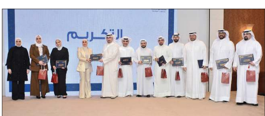
وكيل وزارة التعليم العالي لمياء الملحوم خلال تكريم المشاركين في الحملة

أن «وجهني» ليست مجرد فعالية عابرة، بل مشروع وطني متجدد يحرص على استمراره وتطويره، تحقيقاً لرؤية صاحب السمو الأمير الشيخ مشعل الأحمد في بناء الإنسان الكويتي المبدع القادر على خدمة وطنه وتحقيق تميزه. وفي ختام الحفل، قامت الوكيلة ومستشار الوزير ورئيس فريق حملة وجهني بتكريم المؤسسات الداعمة، والجهات المشاركة، وأعضاء الفريق العامل في الحملة، مؤكداً أن هذا التعاون بين الجهات الحكومية والأهلية المتميزة وإسهامهم الفاعل في الحملة. وأكدت في ختام كلمتها