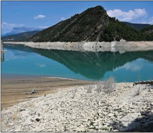
تراجع مستوى المياه في بحيرة ميديانو بإسبانيا (أ.ف.ب)

باريس - أ.ف.ب: استمرت موجة الجفاف في أوروبا وحوض المتوسط بحدّة استثنائية مطلع أغسطس مع تأثر أكثر من نصف الأراضي (51,3٪) وفق تحليل أجرته وكالة فرانس برس لأحدث بيانات المرصد الأوروبي للجفاف. ولم يسجل معدل مرتفع كهذا من قبل للفترة من 1 إلى 10 أغسطس منذ بدء الدراسات عام 2012.