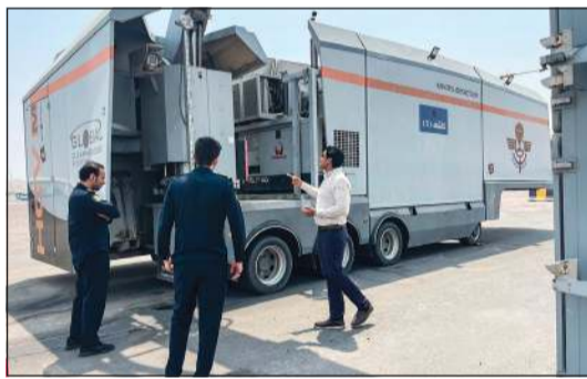
كوادر جمارك الصليبية وشيرة الخضار ذربت على جهاز فحص الباليئات

تشغيل واستخدام جهاز فحص الباليئات، الذي تم إدرجه حديثاً ضمن منظومة العمل في إدارة جمارك الصليبية وشيرة الخضار.