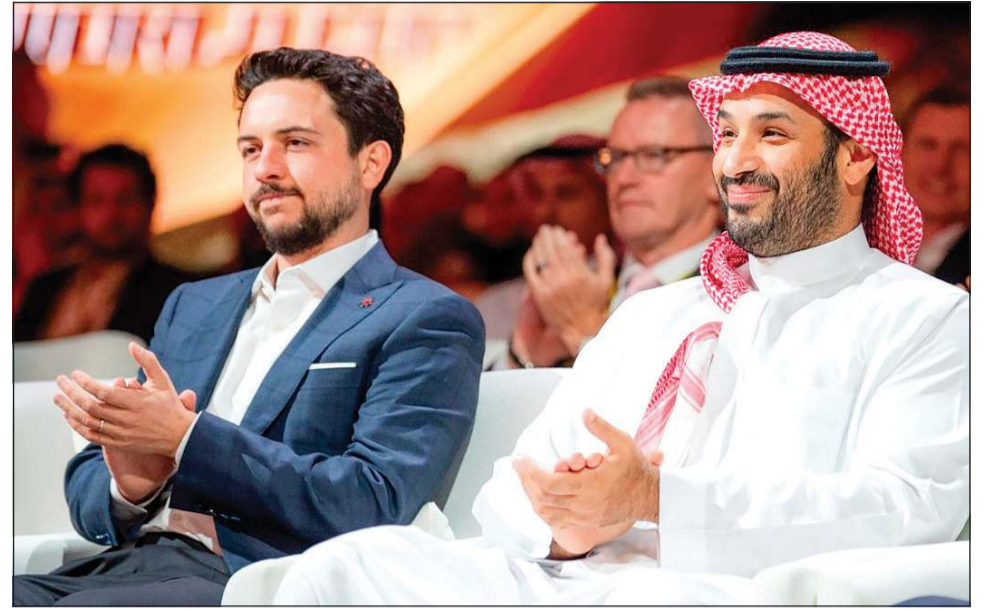
صاحب السمو الملكي الأمير محمد بن سلمان ولي العهد رئيس مجلس الوزراء السعودي ولي عهد الأردن الأمير الحسين بن عبدالله الثاني خلال حفل ختام بطولة كأس العالم للرياضات الإلكترونية

وانطلقت بطولة كأس العالم للرياضات الإلكترونية بفكرة سعودية، أعلن عنها صاحب السمو الملكي الأمير محمد بن سلمان ولي العهد رئيس مجلس الوزراء السعودي، في 2023، لتستضيف الرياض نسختها الأولى في 2024 محققة نجاحا عالميا لافتا، مما مهد الطريق لتنظيم نسخة الثانية في 2025 بمستوى تنظيمي وتقني غير مسبوق. واحتضنت منطقة «بوليفارد رياض سيتي» على مدار أيام البطولة، أكثر من 3 ملايين زائر، فيما تابع المنافسات عبر المنصات الرقمية أكثر من 750 مليون مشاهد حول العالم، بمعدل مشاهدة إجمالي تجاوز 350 مليون ساعة، كما شهدت الفعاليات المصاحبة تنظيم أكثر من 1500 فعالية مجتمعية وثقافية وترفيهية، أثرت التجربة وأضفت على الحدث طابعا إنسانيا وتفاعليا.