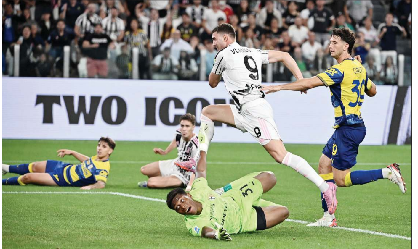
مهجم يوفنتوس دوشان فلاهوفيتش يسجل الهدف الثاني في مرمى بارما

47، بعد مجهود فردي في منتصف الميدان، كرة بنية متقنة وضعت زميله الجديد القادم من سلتا فيغو الإسباني، أناستاسيوس دوكيكاس منفردا في مواجهة حارس لاتسيو إيفان بروفيديل، فأنهالها اليوناني بشكل مثالي مانحا كومو التقدم.