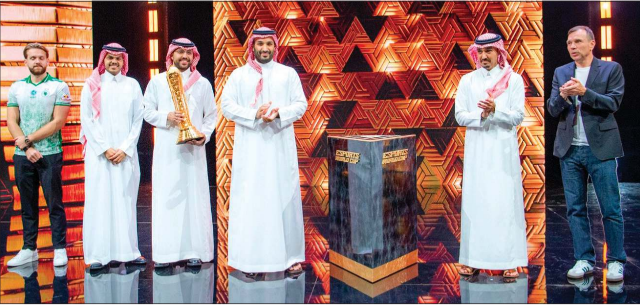
صاحب السمو الملكي الأمير محمد بن سلمان ولي العهد رئيس مجلس الوزراء السعودي صاحب السمو الملكي الأمير عبدالعزيز بن تركي الفيصل ورالف رايشرت خلال تتويج الفريق الفائز بكأس العالم للرياضات الإلكترونية