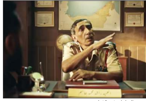
مرعي الحليان في الفيلم

وتعود المشاركة الأولى لفرقة المسرح الكويتي في مهرجان القاهرة للمسرح التجريبي إلى عام 1989 من خلال مسرحية «الشفاف» تأليف فوزي غريب وإخراج عبدالأمير مطر، ثم عام 1990 من خلال مسرحية «الستار» تأليف فوزي غريب وإخراج عبدالعزیز المسلم، وفي عام 1992 مسرحية «الحريق» تأليف حمدي عباس واحمد السلطان وإخراج السلطان،