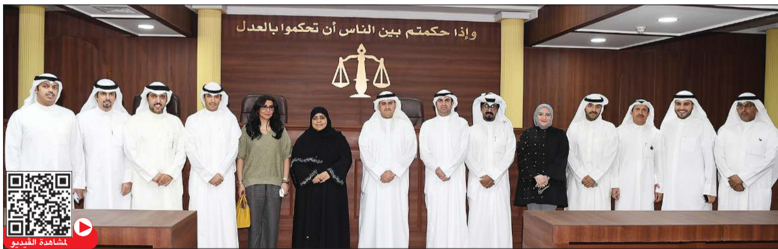
وزير العدل المستشار ناصر السميط ووكيل الوزارة بالتكليف عواطف السند والوكيل المساعد بالتكليف نواف القبندى خلال زيارتهم إلى مقر جمعية المحامين بحضور رئيس الجمعية عدنان أبل وأمين السر خالد السويغان وعدد من المشاركين في اللقاء

وأضاف أن مشروع قانون الإجراءات والمحاکمات الجزائية الجديد سيضمن تمكين المهتم والمشبه فيه من التزام الصمت وعدم التحدث والاستعانة بمحام في جميع الإجراءات التي تقوم بها الشرطة الجنائية وأمن الدولة، وذلك منصوص عليه بالبعد الدولي لحقوق السياسية.