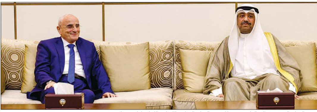
وزير الدفاع الشيخ عبدالله العلي مستقبلاً وزير الدفاع الوطني اللبناني اللواء طيار ميشال منسى

ورئيسي رئيس جمهورية الأوروغواي الشرقية الصديقة، ضمنها سموه خالص تهانيه بمناسبة ذكرى استقلال بلاده، متمنياً سموه له موفور الصحة والعافية لجمهورية الأوروغواي الشرقية وشعبها الصديق كل التقدم والنماء. من جهة أخرى، وصل إلى البلاد وزير الدفاع الوطني للجمهورية اللبنانية الشيخة الشقيقة اللواء طيار ميشال منسى يرافقه وفد رفيع المستوى، في زيارة رسمية تستغرق عدة أيام، وكان في استقباله لدى وصوله إلى أرض المطار وزير الدفاع الشيخ عبدالله العلي،