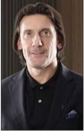
المونتينيغري نينوشا يوفوفيتش