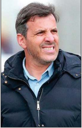
البرتغالي ماركو الفيس