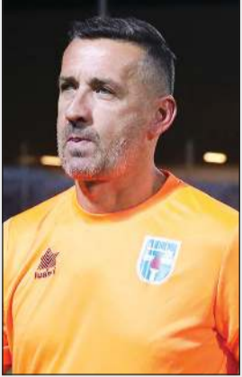
الكرواتي دراغان تاديتش