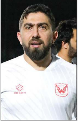
السوري فراس الخطيب