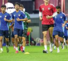
منتخبنا الأولمبي يواصل تدريباته الجدية في تايلند

في معسكره بتايلند، إذ فاز في مباراته الأولى على فريق نونتايبوري التايلندي 0-2، ثم على منتخب ماليزيا 0-1. وفي جانب آخر، التحق أمس ببعثة الأولمبي ثلاثي