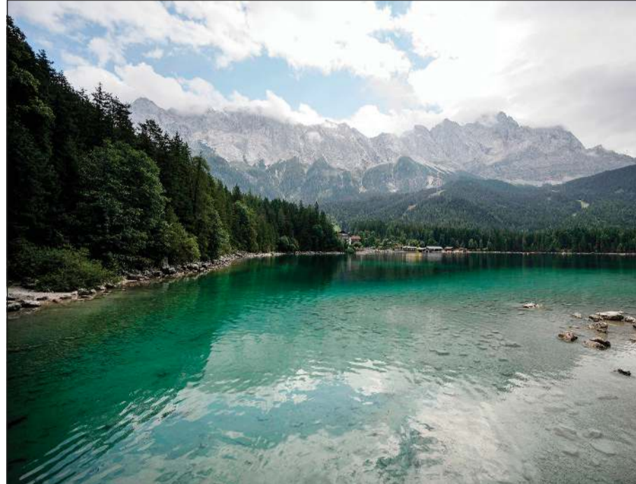
صورة عامة لبحيرة آيبسي عند سفح جبل تسوغ شبيتسه أعلى قمة في ألمانيا