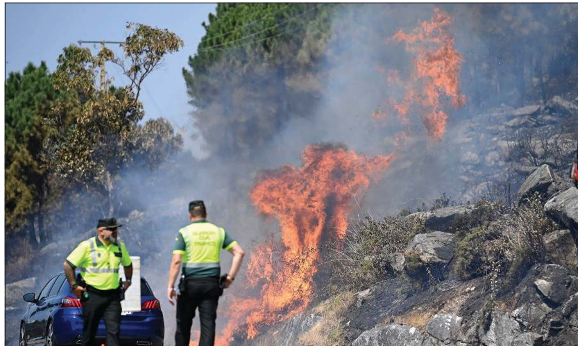
الدفاع المدني يوجه السيارات قرب قرية موغاس شمال غرب إسبانيا

وأثرت هذه الحرائق الكبيرة خصوصا على النصف الغربي من البلاد، لاسيما مناطق غاليسيا وقشتالة وليون وإكستريمادورا، واندلعت في خضم موجة حر استمرت 16 يوما وصلت خلالها الحرارة إلى 40 درجة مئوية في أنحاء البلاد و45 درجة مئوية في العديد من المناطق الجنوبية.