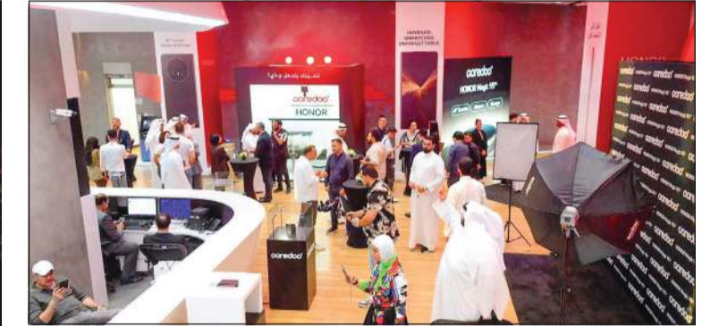
جانب من إقبال العملاء على استكشاف العروض المميزة على أجهزة «HONOR» الجديدة من «Ooredoo» الكويت

في خطوة تعكس ريادتها الرقمية في السوق الكويتي، أعلنت شركة Ooredoo عن الإطلاق الرسمي للجهاز الذكي الجديد كلياً «HONOR Magic V5»، والذي أصبح متاحاً عبر فروعه وقنواتها الإلكترونية، ويؤكد هذا الإطلاق التزام الشركة بتأمين عملائها من الاستفادة من أحدث التقنيات، انسجاماً مع شعارها: «طور عالمك». وشهدت فعاليات الإطلاق، التي احتضنها البرج الرئيسي لشركة Ooredoo، حضور نخبة من العملاء الأوفياء وعشاق التكنولوجيا، حيث استمتعوا باسبعية مميزة تخللتها عروض موسيقية حية وأنشطة تفاعلية متنوعة، إلى جانب فرصة فريدة لتجربة أحدث أجهزة HONOR مباشرة. ولم يقتصر الاحتفال على الإعلان عن وصول الجهاز الجديد كلياً، بل امتد ليرز المزايا الإضافية والوظائف المتطورة التي يقدمها، والتي من شأنها الارتقاء بتجربة الحياة اليومية في عالم متصل بالكامل. وتضم التشكيلة الجديدة التي توفرها «Ooredoo» الكويت من أجهزة «HONOR» مجموعة من أحدث ابتكاراتها، تشمل: «HONOR Magic V5»