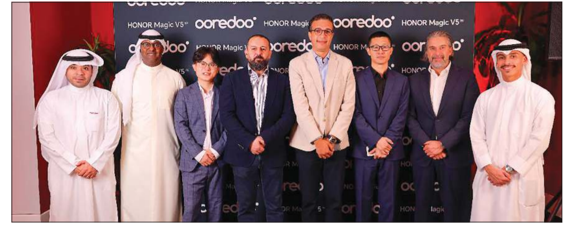
لقطة جماعية لمطلي شركتي «Ooredoo» الكويت و«HONOR»، خلال الكشف عن الأجهزة الجديدة

تؤكد التزامها بتأمين عملائها من الاستفادة من أحدث التقنيات