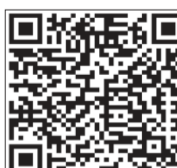
للإطلاع على بيان إخلاء المسؤولية