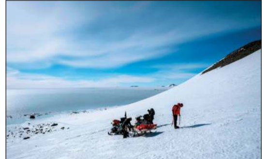
علماء يجرّون دراسة لجامعة سانتياغو حول أثر وجود المعادن الثقيلة على القارة القطبية الجنوبية

سانتياغو - أ.ف.ب: تتأثر القارة القطبية الجنوبية (أنتاركتيكا) منذ سنوات بالاحترار المناخي، لكن الأضرار آخذة في التزايد بفعل آثار السياحة وبعثات البحث العلمي، وفق دراسة حديثة نشرت نتائجها مجلة «استدامة الطبيعة» Nature Sustainability.