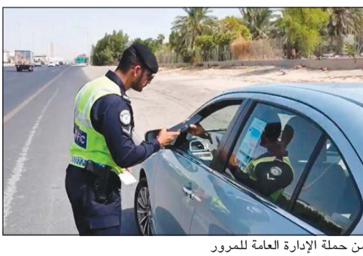
من حملة الإدارة العامة للمرور

وأُسفرت الحملة، حسب بيان صادر عن وزارة الداخلية، عن تحرير 3239 مخالفة مرورية وحجز مركبتين وإحالة 3 مخالفين إلى نظارة المرور، وضبط 56 مركبة مطلوبة قضاثياً، و33 مطلوبين قضاثياً و115 مخالفاً لقانون الإقامة والعمل و12 حدثاً لقيادتهم مركبة من دون رخصة، إلى جانب