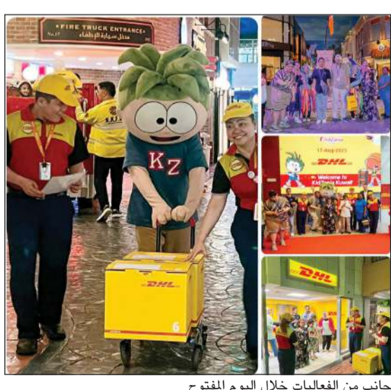
جانب من الفعاليات خلال اليوم المفتوح

مساحتها لاستضافة الأطفال والترحيب بهم من جميع مناحي الحياة، والمساهمة داخل مجتمعها لجعل العالم مكاناً أفضل، ونحن نهدف إلى ضمان التزامنا تجاه المجتمع وأن نكون حليفاً نشطاً نحو التقدم الاجتماعي. والجمعية الكويتية لرعاية المعوقين هي مؤسسة غير ربحية تهدف إلى تحسين جودة الحياة للأشخاص ذوي الإعاقة في الكويت وتقديم الجمعية مجموعة واسعة من الخدمات بما في ذلك الرعاية الطبية، الدعم التعليمي، التأهيل المهني، والخدمات الاجتماعية لأكثر من 400 طالب. وتركز الجمعية على تعزيز الاندماج المجتمعي للأشخاص ذوي الإعاقة وتوفير بيئة داعمة تمكنهم من تحقيق إمكاناتهم الكاملة ومن خلال برامجها ومبادراتها المتنوعة. كيدزانيا مفهوم معترف به دولياً وحائز عدة جوائز عالمية، وذلك لجزءه الفريد بين الترفيه والتعليم للأطفال ولرؤى أكثر من 12 عاماً على تواجدها في الكويت تقدم كيدزانيا بالشكر إلى شركائها الذين يزيد عددهم على 36 شريكاً.