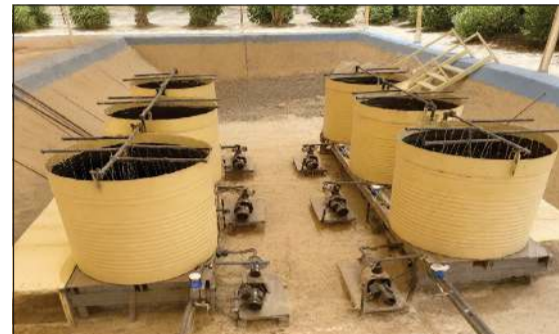
نظام الأراضي الرطبة لمعالجة المياه العادمة الناتجة عن معالجة مياه الصرف الصحي بالتناضح العكسي

(كويتا): أعلن معهد الكويت للأبحاث العلمية عن حصول مركز أبحاث المياه التابع له على براءة اختراع لنظام الأراضي الرطبة لمعالجة المياه العادمة الناتجة عن معالجة مياه الصرف الصحي بالتناضح العكسي، وذلك من خلال المشروع الممول من مؤسسة الكويت للتقدم العلمي بعنوان: «دراسة نمطية لأنظمة الأراضي الرطبة لمعالجة المياه العادمة الناتجة عن معالجة مياه الصرف الصحي المعالجة بالتناضح العكسي».