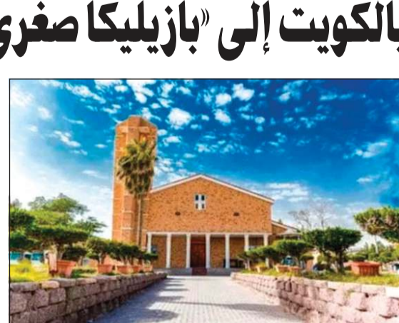
امتدانه قائلًا: «إن هذا التكريم البايوي بشكل مصدر فخر واعتزاز لجميع المسيحيين من المواطنين والمقيمين في الكويت، ويعكس التقدير العميق الذي

كما رفع أسمي الشكر والتقدير إلى مقام صاحب السمو الأمير الشيخ مشعل الأحمد، والسي سمو ولي العهد الشيخ صباح الخالد، والسي الحكومة الكويتية على تعاونها الكريم ودعماًها المتواصل لمسيرة التعايش المشترك في البلاد. وختم بأن رفع كنيسة سيدة الجزيرة العربية - الأحمدى إلى «بازيليكافغرى» حدث تاريخي وروحي عالمي، يعكس عراقة الكنيسة في الكويت، ويضع البلاد في مصاف الدول التي تحتضن كنائس بارزة لها قيمة دينية وروحية عالمية.