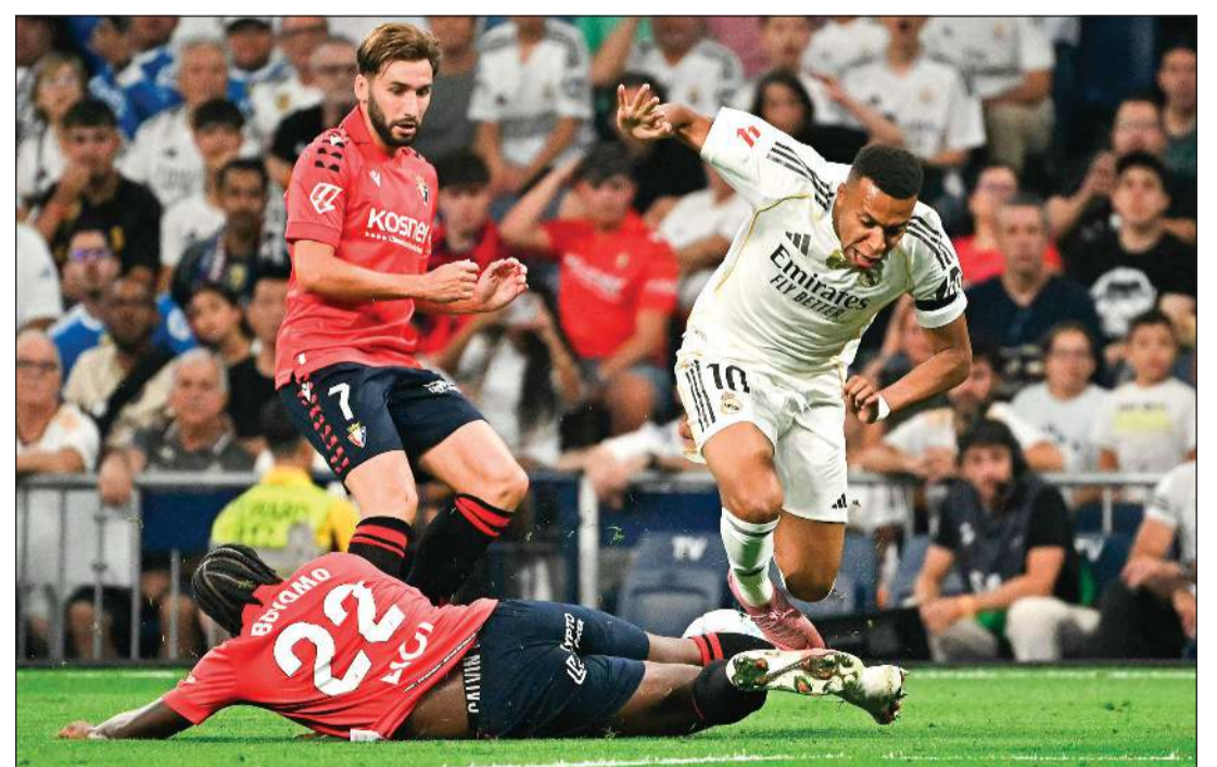
كيليان مبابي يتعرض للتعرقلة من مدافع أوساسونا فلافين بويوم

قاد النجم الفرنسي كيليان مبابي فريقه ريال مدريد لتحقيق بداية وأعدة تحت قيادة مدربه الجديد شابلي ألونسو، بتغلبه على أوساسونا بهدف وحيد في ختام المرحلة الأولى من الدوري الإسباني لكرة القدم أمس الأول. وجاء هدف مبابي من ركلة جزاء (51) ليمنح «النادي الملكي» النقاط الثلاث في مستهل حملته لاستعادة اللقب من غريمه التقليدي برشلونة وفي الظهور الأول لألونسو منذ توليه قيادة الفريق، في سانتياغو برنابيو. وفي مباراته الأولى مدربا في الدوري الإسباني أيضا،