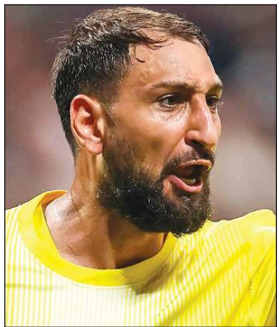
دوناروما يقترب من «السيتي»

دخل باريس سان جرمان، بطل الدوري الفرنسي ودوري أبطال أوروبا لكرة القدم، في مفاوضات مباشرة مع مان سيتي الإنكليزي الساعي للحصول على خدمات الحارس الدولي الإيطالي جانلويجي دوناروما من نادي العاصمة، وذلك وفق ما أفادت التقارير. وقال موقع «كالتشميركاتو» الإيطالي المتخصص بالانتقالات على لسان الصحافي المعروف ألفريدو بيدولا «أجرى باريس سان جرمان ومانشستر سيتي محادثات وثيقة ومباشرة خلال الساعات الـ48 ساعة الماضية، هناك رغبة قوية في التوصل إلى حل على الرغم من أن النادي الفرنسي بدأ بتقييم قيمة دوناروما بتراوح بين 45 و50 مليون يورو، وهو رقم من الواضح أن «السيتي» لا ينيو دفعه». ورأى أنه «من الممكن الوصول إلى حل وسطي، لكن في الوقت نفسه يجب فتح مفاوضات بشأن إيدرسون، في إشارة إلى الحارس البرازيلي مانشستر سيتي المرشح انتقاله إلى غلطة سراي التركي المستعد لدفع بين 10 و12 مليون يورو، في حين أن