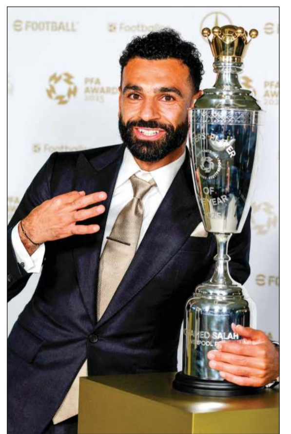
محمد صلاح أول لاعب يفوز بجائزة لاعب العام للمرة الثالثة

أصبح المصري محمد صلاح أول لاعب يفوز بجائزة لاعب العام المقدمة من رابطة اللاعبين المحترفين في إنجلترا للمرة الثالثة أوس 2017-2018 بعد أن قاد ليغربول للقب الدوري الإنكليزي في كرة القدم. وأحرز المصري 29 هدفا مع 18 تمريرة حاسمة ليقدود «الحمر»، إلى الفوز بلقبه التاسع عشر في الدوري الممتاز ومعادلة الرقم القياسي، وسبق لصلاح أن توج بالجائزة في موسمي 2017-2018 و2021-2022. كما نال الدولي المصري جائزتي لاعب العام المقدمتين من رابطة الصحفيين ورابطة الدوري الممتاز في الأشهر الأخيرة. واختير أيضا إلى جانب صلاح ضمن تشكيلة العام ثلاثة من زملائه وهم الهولنديان فيرجل فان دايك، وراين غرافنبوخ، والأرجنتيني الكسيس ماك اليستر. كما تواجد في التشكيلة المجري ميلوش كيركيز المضم من بورنموث إلى ليغربول في يونيو الماضي، إضافة إلى ثلاثي أرسنال الفرنسي وويليام صالبيبا، البرازيلي غابريال ماغالهايس وديكان رايس. واختير أيضا الحارس البلجيكي ماتس سيلز والنرويجي يندري كرييس وود بعد عرضهما الشيق مع نوتنغهام فورست، إضافة إلى مهاجم نيوكاسل السويدي الكسندر إيزاك الراجب بالرحيل عن الـ«ماغليان»، بعد حلوله ثانيا في قائمة هدافي روجرز جائزة أفضل لاعب شاب بعد أدائه الذي شرع له أبواب المنتخب الإنكليزي. وفازت لاعبة أرسنال الإسبانية ماريونا كلدينتي بجائزة لاعبة العام بعد مساعدة فريقها على الفوز بدوري أبطال أوروبا.