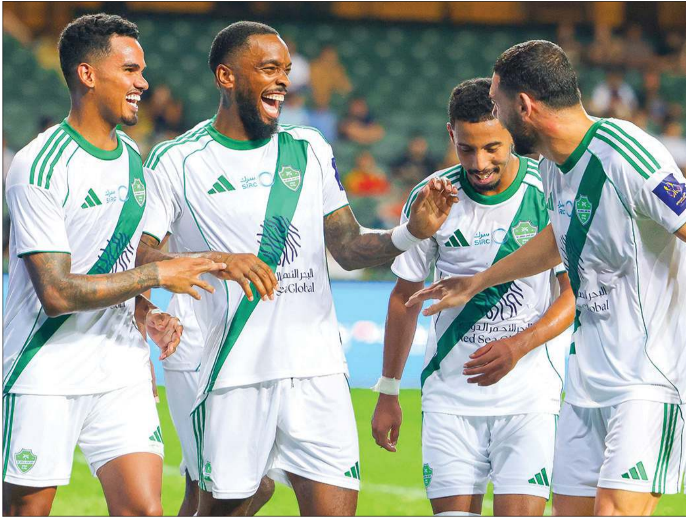
فرحة لاعبي الاهلي بالفوز على القادسية

لحق فريق أهلي جدة بنظيره النصر إلى نهائي بطولة كأس السوبر السعودي المقامة في هونغ كونغ، وذلك بعد فوزه في نصف النهائي 5-1 على القادسية، الذي يخوض كأس السوبر للمرة الأولى في تاريخه، بينما شارك الأهلي في مناسبتين سابقتين وتوج باللقب على حساب الهلال عام 2016. أحرز القادسية هدفا مبكرا عن طريق ألفاريز في الدقيقة الثامنة من متابعة لتمريرة زميله الغاني بونسو باه من الجهة اليسرى، وعادل الإيفواري فرانك كيسيبة النتيجة للأهلي في الدقيقة 12، وأعقبه زميله الإنجليزي إيفان توني بهدف ثان في الدقيقة 28 من ركلة جزاء. وأحرز الوافد الجديد إنزو ميلو الهدف الثالث للأهلي في الدقيقة 31 بضربة رأس من متابعة لكرة العرضية التي أرسلها الجزائري رياض محرز من الجهة اليسرى. وفي الدقيقة 42 أشهر الحكم البطاقة الحمراء في وجه بونسو باه ليلتكر القادسية منقوض العدد، بعد تدخله الخش على روجر إيبانيز. وعاد كيسيبه ليسجل الهدف الثاني له والرابع لفريقه في الدقيقة 45 بضربة رأسية من متابعة لعرضية محرز من الجهة اليسرى. وأحرز الإسباني ناتشو قائد القادسية، الهدف الخامس للأهلي في الدقيقة 61 أثناء محاولته إبعاد تمريرة البرازيلي جالينو. وشهدت المباراة عدة تبديلات من الجانبين، حيث دفع الأهلي بكل من علي مجرشي، وعيد المولد، وفهد الرشيد، ويأسين الزبيدي، وكامبيرون بويرتاس، بينما أجرى القادسية تغييرات شملت دخول جهاد ذكري، ومحمد آل قاضي، وجولييان كوينونيس، وماتيو ريتيغي، وصالح أبو الشامات، وقاد اللقاء الحكم الإسباني ريكاردو دي بيرغوس وينتظر النصر في نهائي كأس السوبر