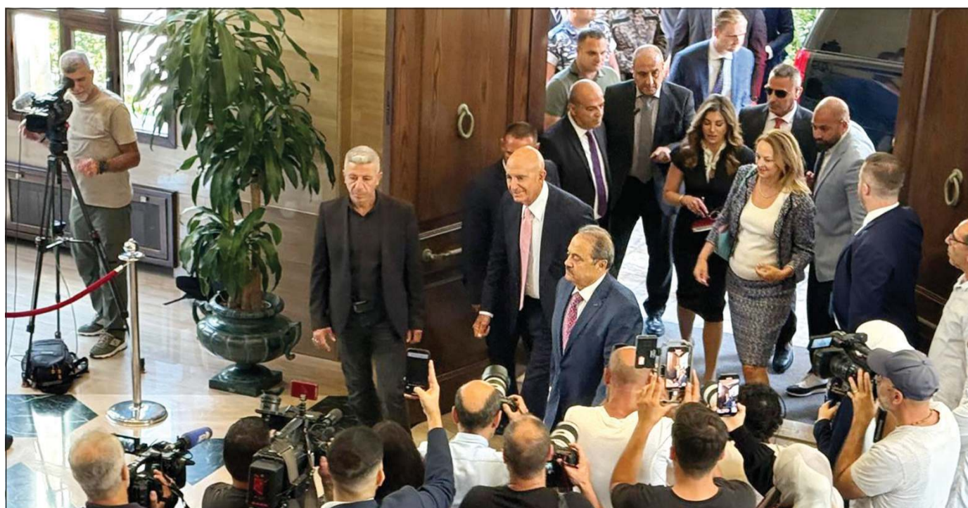
البعوث الأميركي توماس باراك محاطاً بالصحافيين لدى وصوله إلى عين التينة للقاء الرئيس نبيه بري

ومع اقتراب السنة الثانية على تهجير أبناء البلدات الحدودية منذ إعلان «حزب الله» إطلاق «حرب الإنسان»، بدأت ترتفع أصوات أبناء هذه القرى عن تشكيل تجمع شعبي لإنهاء القرى الحدودية، وتم تقديمه بأنه بعيد عن السياسة، وأن كل ما يسعى إليه هو العمل على إيجاد سبل لعودة السكان إلى بلداتهم، في ظل ما يعاني منه المهجرون من غياب أي مساعدات أو تغطية، سواء من الحكومة أو من هيئات حزبية أو إجتماعية، مع العجز عن تأمين بدلات الإجراءات وأكلاف الحياة المرتفعة خارج تلك البلدات والقرى.