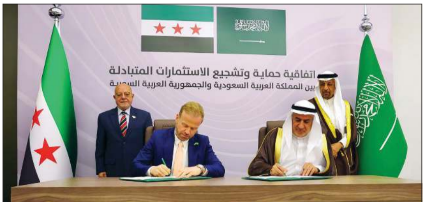
مراسم توقيع اتفاقية تشجيع الاستثمار بحضور وزير الاستثمار السعودي خالد الفالح ووزير الاقتصاد السوري محمد الشعار

وكالات: أعلنت وكالة الأنباء السعودية الرسمية «واس» عن زيارة وفد سوري اقتصادي برئاسة وزير الاقتصاد السوري الدكتور محمد نضال الشعار، إلى المملكة، وذلك امتداداً لتوجيهات صاحب السمو الملكي الأمير محمد بن سلمان بن عبدالعزيز، ولي العهد رئيس مجلس الوزراء، بتعميق وتطوير الشراكة بين المملكة العربية السعودية والجمهورية العربية السورية. وأكدت «واس» أن الزيارة تأتي استمراراً لمخرجات المنتدى الاستثماري السعودي - السوري الذي عقد الشهر الماضي في دمشق برعاية الرئيس السوري أحمد الشرع، وبمشاركة أكثر من 100 شركة سعودية و20 جهة حكومية من المملكة