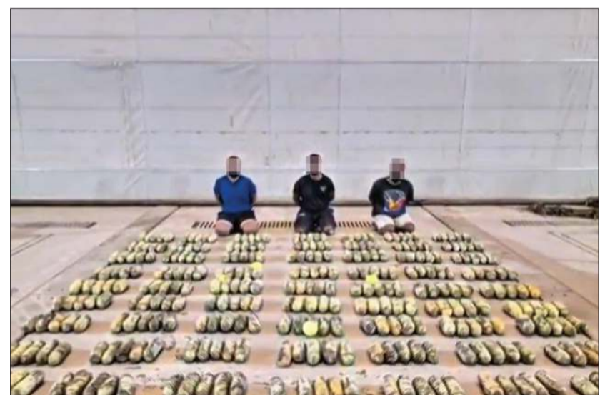
المتهمون الثلاثة وأمامهم المضبوطات من المواد المخدرة