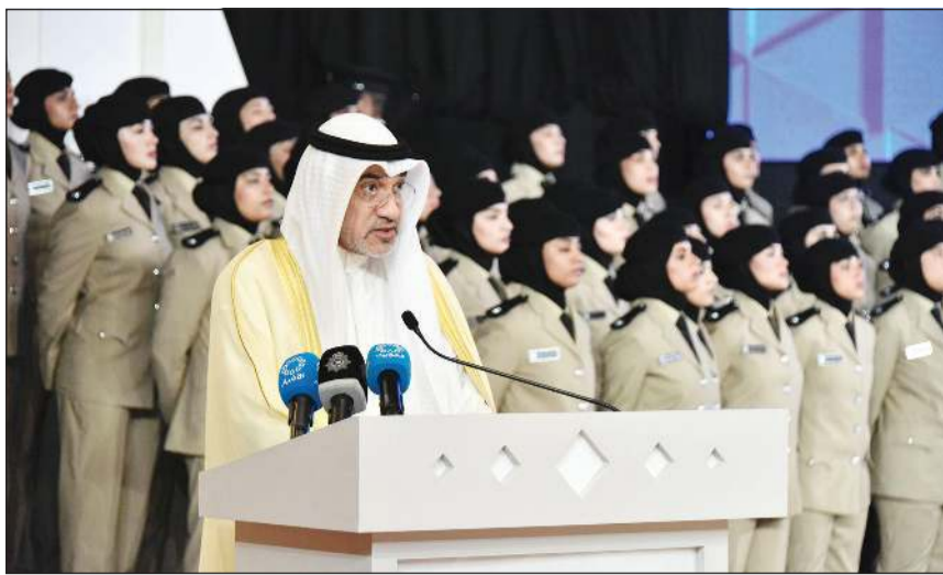
النائب الأول لرئيس مجلس الوزراء ووزير الداخلية الشيخ فهد اليوسف يلقي كلمته خلال حفل تخريج الدفعة الـ14 من منتسبات معهد الشرطة النسائية