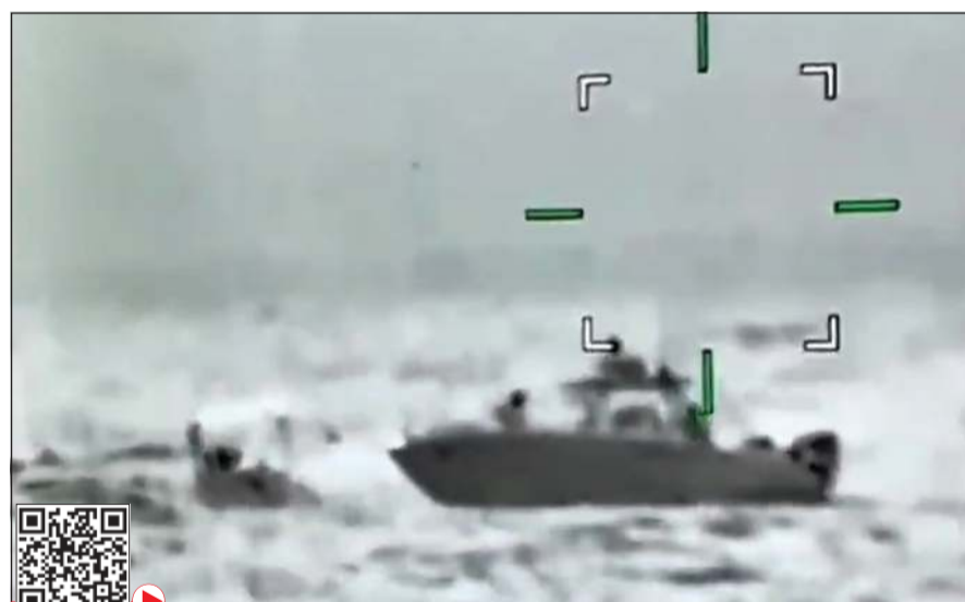
زورق المهربين رصد عبر كاميرات القوارب المسيّرة