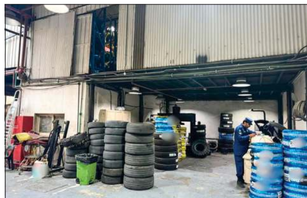
حملة الشويخ استهدفت العديد من المنشآت والمخبرات

ووفق مصدر أفاد بأنه خلال تجول إحدى دوريات إسناد مديرية أمن مبارك الكبير مساء أول من أمس في منطقة أسواق القرين تم الاشتباه بشخص يسير على الأقدام، وبعد التوجه له وضبطه وبالإستعلام عنه اتضح أنه مطلوب على ذمة قضية، وبتفتيشه عثر بحوزته على كيبس به مادة الشبو وآخر به مادة الكيميكاك. وعليه تمت إحالته وأخبر به مادة الكيميكاك إلى الإدارة العامة لمكافحة المخدرات.