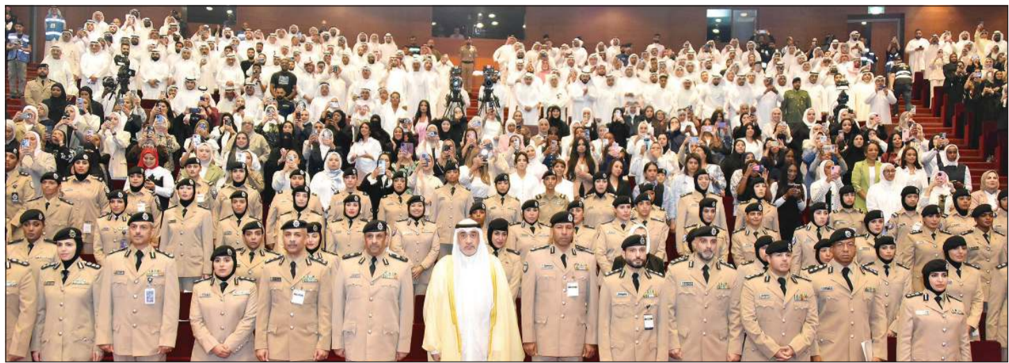
النائب الأول لرئيس مجلس الوزراء ووزير الداخلية الشيخ فهد اليوسف ووكيل وزارة الداخلية بالتكليف اللواء علي مسفر العدواني وعدد من القيادات الأمنية خلال حفل تخريج الدفعة الـ14 من منتسبات معهد الشرطة النسائية

شهد حفل تخريج الدفعة الـ14 من منتسبات معهد الشرطة النسائية منهن 132 برتبة ملازم و31 برتبة وكيل ضابط و8 برتبة رقيب