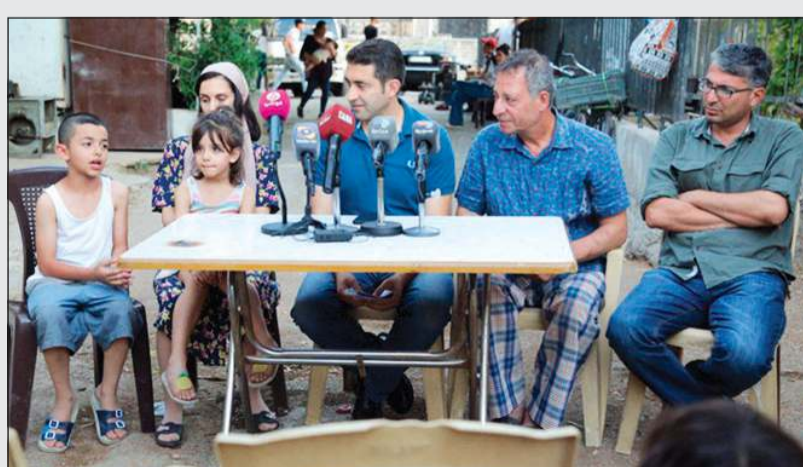
صور من فيلم «أماني» المشارك في المهرجان