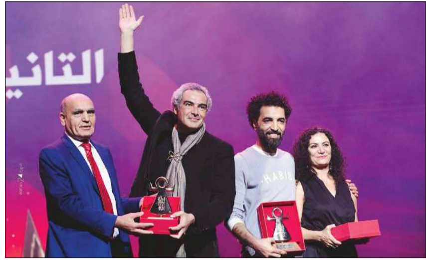
المخرج سليمان البسام وفريق عمله وفوزهم السابق في مهرجان قرطاج المسرحي

قدم المخرج د.سليمان البسام المسرحي عمله «صمت» MUTE أمس الأول ضمن فعاليات مهرجان الحرية للمسرح والذي يقام بمدينة نارفا في إستونيا، وقد شهدت هذه المشاركة انتصاراً لحملة مقاطعة الكيان الإسرائيلي وصولاً إلى إسقاط عرض صهيوني من برنامج المهرجان، يقول البسام في بيان صحفي: «جربنا على العادة في التعااطي مع المهرجانات الأجنبية فقد أبلغنا المهرجان بتعذر مشاركتنا في حال مشاركة أي عرض إسرائيلي بالمهرجان، وكانت الأمور تجري على ما يرام لنفاجاً حين وضع العروض على موقع المهرجان قبل أيام بإدراج عرض إسرائيلي ضمن البرنامج، فقمنا بمراسلة المهرجان والتذكير باتفاقنا فكان الرد بأنهم سيحرضون على عدم التقاطع بين فريق عملنا وفريق العرض الصهيوني في الأماكن والفعاليات وقاعات العرض، وهو ما رفضناه رفضاً قاطعاً». ويضيف البسام: «قمنا باجتماع لفريق العمل الذي يضم عناصر عربية من الكويت ولبنان وسورية وتونس والعراق، بالإضافة