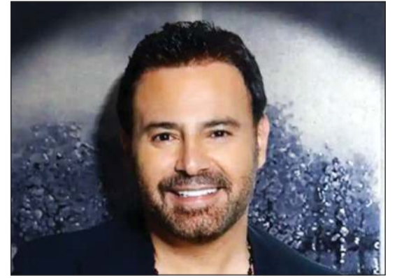
بيروت - بولين فاضل

أطلق الفنان عاصي الحلاني أحدث أعماله الغنائية بعنوان «قلبي شاطر»، في تعاون فني جديد يضيف إلى مسيرته الحافلة بالتجديد والتنوع، الأغنية من كلمات الشاعر نعمان الترس، وألحان خليل أبو عبيد، أما التوزيع والماسترينغ فحملتا توقيع ريمي مراد، اللذين شكلا مع الحلاني ثلاثياً متناعماً أنتجوا عملاً عصرياً بللمسة عاطفية مرهفة. «قلبي شاطر» تأتي بروح شبابية ونغمة رومانسية تنبض بالإحساس، وتظهر جانباً مختلفاً من شخصية عاصي الغنائية.