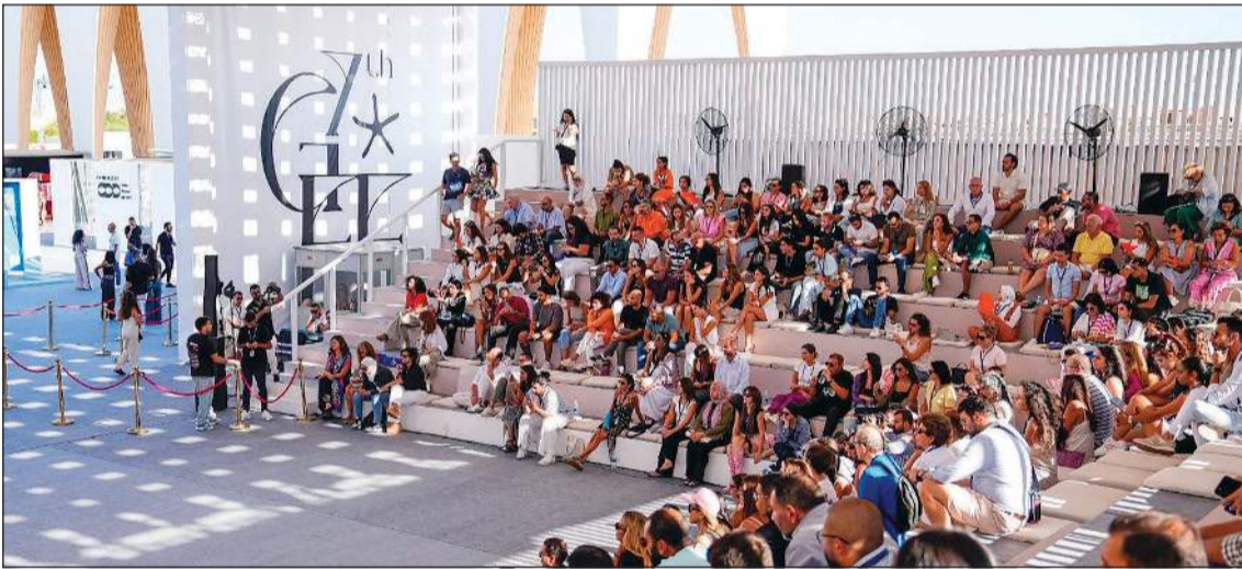
جانب من الدورة السابقة لمهرجان الجودة السينمائي

وتجسد دينا في فيلم «درويش» دور زوجة «درويش»، الذي يلعب بطولته الفنان عمرو يوسف، وتدور أحداثه في إطار درامي مشوق حول شخصية محتمل كاريزمي يدخل في سلسلة من التحديات التي تقلب حياته رأساً على عقب، ليجد نفسه أمام فرصة للتحوّل إلى بطل من طراز مختلف، يجمع بين البساطة والدهاء والطابع الإنساني.