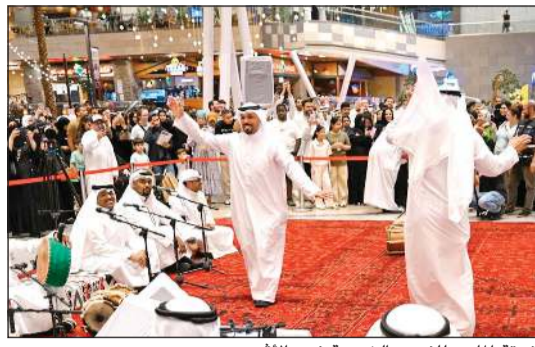
فرقة الماص للفنون الشعبية في «الأقنيون»

عزة كما في لبنان وسورية واليمن، وأن أعضاء فريق العرض الإسرائيلي صهاينة صرحاء، وهم جزء لا يتجزأ من آلة الدعاية الإسرائيلية، ومشاريع التبييض الثقافي، ومنهم ممثلة تتحدث علانية على موقعها الإلكتروني عن ضرورة تدمير مبادئ حركة المقاطعة وفرض العقوبات. وركز الكتاب على أن «الإبادة الجماعية الإسرائيلية المستمرة ليست وجهة نظر أو مسألة رأي، بل هي جريمة موصوفة وموثقة بحسب الأمم المتحدة والمحكمة الجنائية الدولية».