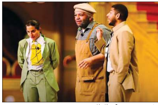
مشهد من مسرحية «ملك المسرح»