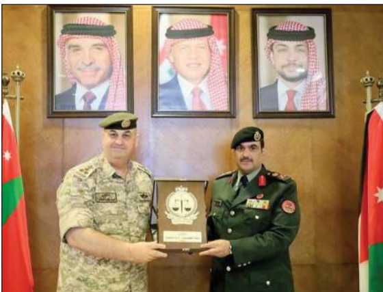
رئيس هيئة القضاء العسكري، في الجيش الكويتي اللواء حقوقي عويد الهطلاني خلال زيارته مديرية القضاء العسكري بالجيش الأردني

عُمان - «كونا»: قال رئيس هيئة القضاء العسكري في الجيش الكويتي اللواء حقوقي عويد الهطلاني إن العلاقات الأردنية - الكويتية - الأردنية تعد نموذجا تعاونيا متكاملًا بمختلف المجالات لا سيما في المجال العسكري. جاء ذلك في تصريح أدلى به الهطلاني لـ «كونا» عقب وصوله إلى العاصمة الأردنية (عمان) على رأس وفد من هيئة القضاء العسكري للقاء عدد من المسؤولين في القضاء العسكري بالجيش الأردني.