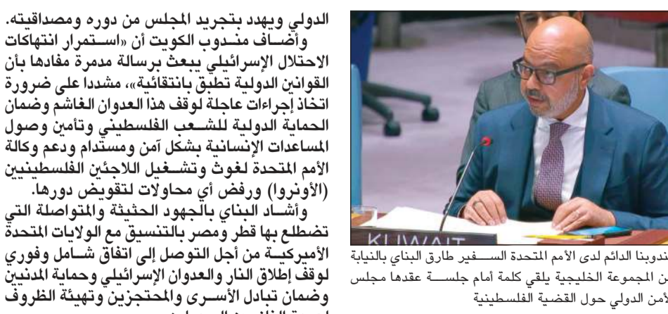
مندوبنا الدائم لدى الأمم المتحدة السفير طارق البناي بالنيابة عن المجموعة الخليجية يلقي كلمة أمام جلسة عقدها مجلس الأمن الدولي حول القضية الفلسطينية

الدولي ويهدد بتجريد المجلس من دوره ومصداقيته. وأضاف مندوب الكويت أن «استمرار انتهاكات الاحتلال الإسرائيلي يبعث برسالة مدمرة مفادها بأن القانون الدولي تطبق بانتقائية»، مشددا على ضرورة اتخاذ إجراءات عاجلة لوقف هذا العدوان الفاشم وضمان الحماية الدولية للشعب الفلسطيني وتأمين وصول المساعدات الإنسانية بشكل آمن ومستدام ودعم وكالة الأمم المتحدة لغوث وتشغيل اللاجئين الفلسطينيين (الأونروا) ورفض أي محاولات لتفويض دورها. وأشاد البناي بالجهود الحثيثة والمتواصلة التي تضطلع بها قطر ومصر بالتنسيق مع الولايات المتحدة الأميركية من أجل التوصل إلى اتفاق شامل وفوري لوقف إطلاق النار والعدوان الإسرائيلي وحماية المدنيين وضمان تبادل الأسرى والمحتجزين وتهيئة الظروف لعودة النازحين إلى ديارهم.