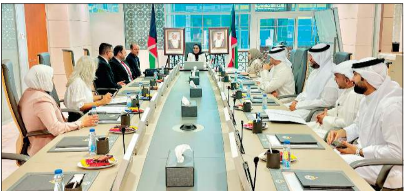
وزيرة الشؤون الاجتماعية وشؤون الأسرة والطفولة د. أمثال الحويلة خلال رئاستها اجتماعا متابعة مشروع تطوير خدمات المجلس الأعلى لشؤون الأسرة

كونا: أكدت وزيرة الشؤون وشؤون الأسرة والطفولة رئيسة المجلس الأعلى لشؤون الأسرة د. أمثال الحويلة حرصها على تطوير الخدمات الرقمية التي يقدمها المجلس في مجالات الإرشاد النفسي والاجتماعي والحماية من العنف الأسري. جاءت تصريحات الوزيرة الحويلة خلال رئاستها اجتماعا متابعة مشروع تطوير خدمات المجلس الأعلى لشؤون الأسرة وإطلاق موقعه الإلكتروني الذي يجري تطويره بالشراكة مع شركة مايكروسوفت لتوفير خدمات متكاملة عبر بيئة رقمية متطورة. وخلال الاجتماع ناقشت الوزيرة الحويلة خطة إطلاق الموقع الإلكتروني والنحضريرات الفنية والتنظيمية لضمان جاهزية المنصة وتسهيل وصول المستخدمين إلى الخدمات الرقمية بفاعلية، مؤكدة استعارة المجلس في تطوير منظومة عمله بما يتوافق مع التشريعات المحلية والاتفاقيات الدولية ذات الصلة.