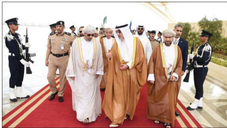
رئيس مجلس الوزراء بالإتابة الشيخ فهد اليوسف مستقبلا وزير الداخلية العماني حمود البوسعيدي بحضور السفير العماني د. صالح الخروصي

كونا: بحث رئيس مجلس الوزراء بالإتابة الشيخ فهد اليوسف مع وزير الداخلية العماني حمود البوسعيدي تعزيز التعاون والتنسيق في مواجهة التحديات الأمنية المشتركة في المنطقة. وذكرت وزارة الداخلية الكويتية في بيان أن الجانبين عقدا جلسة مباحثات رسمية تناولت بحث سبل تطوير الشراكة الأمنية وتعزيز التعاون والتنسيق في مواجهة التحديات الأمنية الإقليمية والدولية.