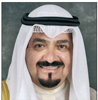
سمو الشيخ أحمد العبدالله

(كونا): بعث سمو الشيخ أحمد العبدالله رئيس مجلس الوزراء ببرقية تهنئة إلى الرئيس المشير محمد إدريس ديبي إتنو رئيس جمهورية تشاد الصديقة - رأس الدولة، بمناسبة ذكرى الاستقلال لبلادها.