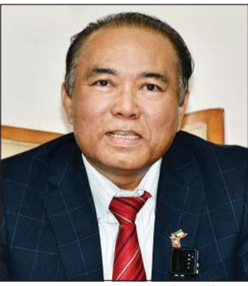
سفير كمبوديا سيمان منان

سيمان منان، أن الكويت تصدر قائمة الدول الداعمة للمشاريع الإنسانية في كمبوديا، وتشمل بناء المدارس للجيلات المسلمة، والمساجد، والمسكن للفقراء، ودور الأيتام، مشيراً إلى وجود 635 مسجداً في 25 محافظة، مع توفر الأطعمة الحلال والخدمات الفندقية الراقية. وفي ملف العمالة، أوضح أن هناك اتفاقية قائمة بين البلدين لاستخدام العمالة الكمبودية لكنها لم تفعل بالكامل بعد، نتيجة بعض التحديات الثقافية والبيئية ومطالبات الرواتب المشابهة لدول أخرى في المنطقة، حيث تتراوح بين ألفي دولار وأكثر. ولفت إلى أن عدد العمالة الكمبودية بالكويت قليل ويتركز في قطاع الفنادق والمنتجعات. كما كشف السفير عن وجود 38 طالباً كمبودياً يدرسون في الكويت، معظمهم في برامج تعليم اللغة العربية بدعم من مؤسسات دينية، مشيراً إلى أن بلاده تتمتع بفرص استثمارية كبيرة في العقارات، والسياحة، والزراعة، والتصنيع، والبنية التحتية.