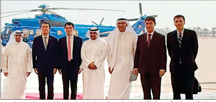
وزير الدولة لشؤون البلدية ووزير الدولة لشؤون الإسكان عبداللطيف المشاري ونائب المدير العام لشؤون التخطيط والتصميم ناصر خريبط والوفد الصيني قبيل الجولة التفقدية على موقع مشروع مدينة الصابرية وموقعين مخصصين للمدن العمالية.

الاستراتيجية والإشراف المباشر من قبل سمو رئيس مجلس الوزراء ومتابعة أعضاء اللجنة الوزارية. في سياق متصل، عقد الوزير المشاري اجتماعاً تشسيقياً رفيع المستوى مع ممثلي الشركتين الصينيتين الحكوميتين كلا على حدة تم خلالها مناقشة آليات التعاون الفني والاستثماري وتبادل الرؤى حول أفضل الممارسات العالمية التي يمكن تطبيقها لتطوير المشروعات المستهدفة.