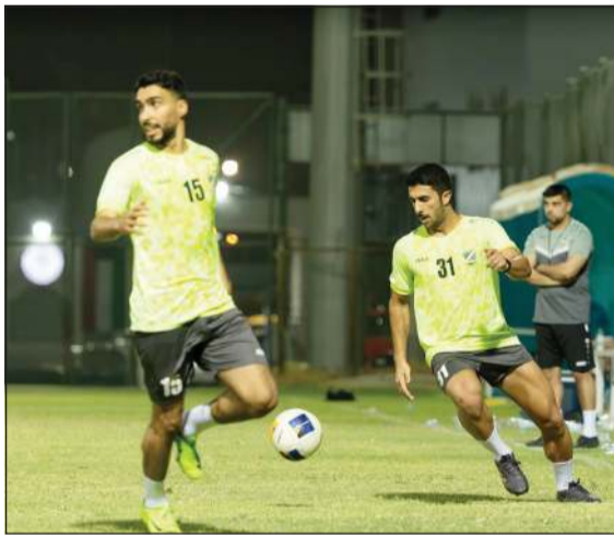
«السماوي» يسعى إلى الاطمئنان على جاهزيته