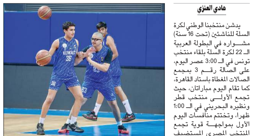
جانب من تدريب سابق لـ «أزرق الناشئين»