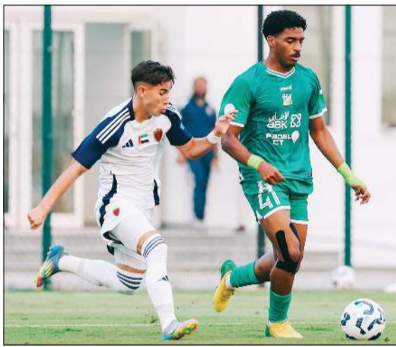
العربي خاض 3 مباريات ودية في أبوظبي استعداداً لمواجهة مأزيا سبورتس المالديفي