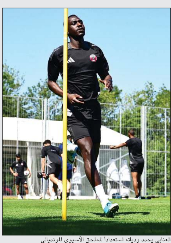
العنابي يحدد ودياته استعدادا للملحق الآسيوي المونديالي

ويستغل «العنابي» ودياته بملاقاة المنتخب البحريني الثلاثاء 3 سبتمبر على ستاد الثمامة، في مواجهة خليجية تحمل طابع التحدي، قبل أن يصطدم بمنتخب روسيا السبت 7 سبتمبر على ستاد جاسم بن حمد بنادي السد، في تجربة أوروبية قوية تعكس رغبة الجهاز الفني في اختبار لاعبيه أمام مدارس كروية متنوعة.