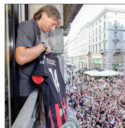
لوكا مودريتش يحيي جماهير ميلان

نكر النجم الكرواتي لوكا مودريتش، أن قراره بالانضمام إلى ميلان الإيطالي كان سهلاً، وأنه يسعى إلى نقل عقلية التنافسية إلى الفريق. وانضم مودريتش إلى صفوف ميلان في صفقة انتقال مجانية بعد 13 عاماً من الإنجازات مع ريال مدريد الإسباني. وقال مودريتش عن هدفه مع ميلان: «كنت على علم بفوز ميلان بـ 7 ألقاب في دوري أبطال أوروبا، وهو الفريق الأكثر نجاحاً في أوروبا بعد ريال مدريد، لا يمكننا أن نرضى بموسم متوسط أو بالتأهل إلى دوري الأبطال فقط، نحتاج إلى التواضع والعمل الجاد لإعادة ميلان إلى القمة»، مضيفاً: «أنا شخص تنافسي للغاية، وأريد نقل هذه الروح للفريق، الهدف الأبدى هو التأهل إلى دوري أبطال أوروبا، لكن ميلان يجب أن يقاتل للفوز بالبطولات».