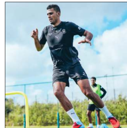
رودري شارك في تدريبات «السيتي»

عاد لاعب الوسط الإسباني رودري للتدريبات الخفيفة مع مان سيتي بعد تعافيه من إصابة في الفخذ، ما يمنح الفريق دفعة معنوية كبيرة قبل انطلاق الموسم الجديد للدوري الإنجليزي الممتاز. ويأمل النادي أن يكون محور خط الوسط البالغ من العمر 29 عاماً جاهزاً لقيادة الفريق في المباراة الافتتاحية ضد ولفرهامبتون 16 أغسطس الجاري.