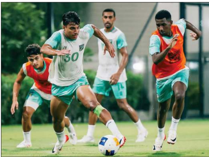
جانب من تدريبات العربي في معسكره بابوظبي