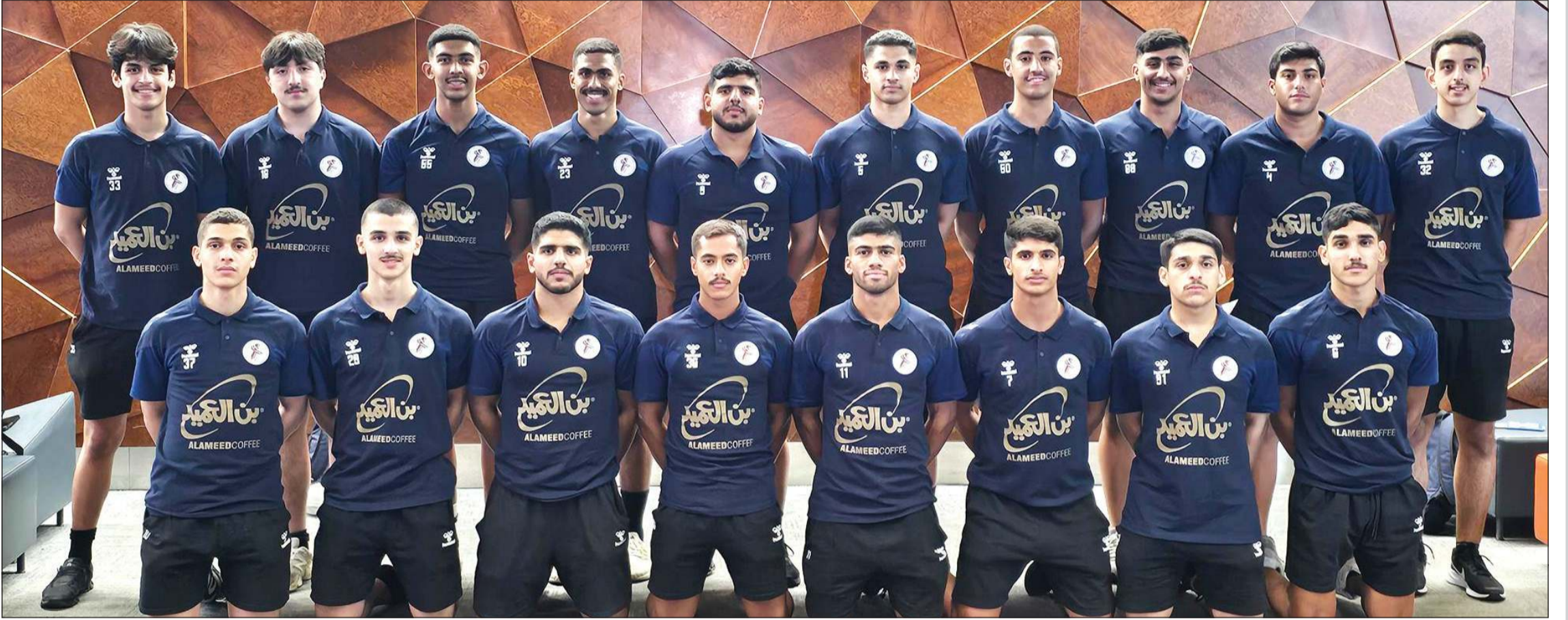
منتخبنا الوطني للناشئين لكرة اليد