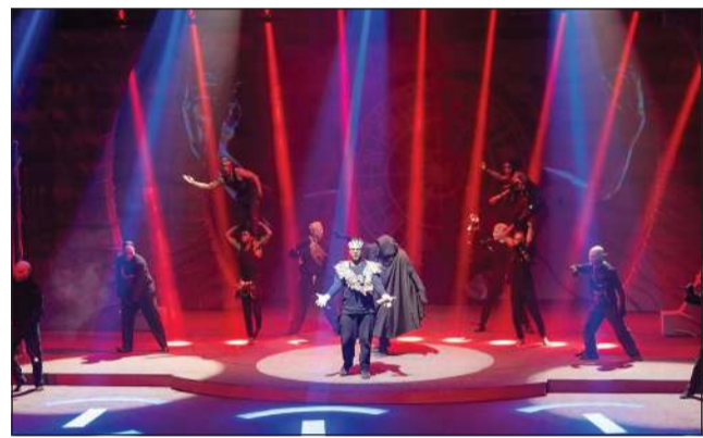
مسرحية «السحر الأسود»