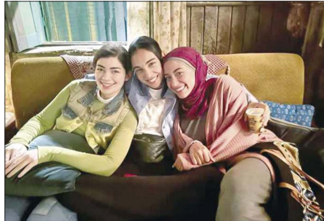
مسلسل «أعلى نسبة مشاهدة»