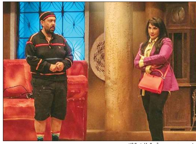
مشهد من مسرحية «الطاق الثاني»

اختتمت الفنانة أصالة فعاليات الدورة الـ 39 من مهرجان جرش للثقافة والفنون في الأردن، بحفل جماهيري أقيم أول من أمس على المسرح الجنوبي. وقدمت أصالة خلال الحفل باقة متنوعة من أروع أغانيها القديمة والحديثة، منها: «عليك الله»، «قد الحروف»، «أسفة»، «أكثر من اللي أنا بحلم بيه»، «يا مجنون مش أنا ليلي»، وغيرها من الأغاني، وسط تفاعل جماهيري لافت، حيث ردد الجمهور الكلمات بحماسة شديدة. ولأردن غنت أصالة «بالعالي يا لأردن بالعالي». وعبرت عن سعادتها بتفاعل الجمهور، مؤكدة أن مهرجان جرش «ركيزة أساسية لكل فنان»، مشيرة إلى أنها تشعر بالفخر بالمشاركة في هذه الليلة التي لن تنسى.