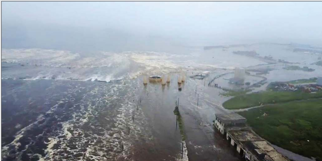
صورة عن فيديو لموجات تسونامي تضرب شواطئ سيفيرو كوريلسك بجزيرة باراموشير شمال الكوريل الروسية

منصهرة على المنحدر الغربي. وهج قوي فوق البركان وانفجارات.. بدورها، ألغت السلطات الفلبينية تحذيرها لعدد من المناطق الساحلية. وتسبب الزلزال في موجات تسونامي بروسيا واليابان وتحذيرات منها في دول مطلة على المحيط الهادئ. لكن وكالة الأرصاد الجوية اليابانية عادت وخفضت مستوى الإنذار بعدة مناطق، وأصدرت دول لها مطلة على المحيط الهادئ شمال القارة الأميركية