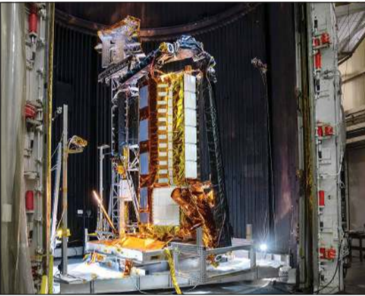
جزء من قمر اصطناعي أميركي - هندي

واشنطن - أ.ف.ب: أطلق أمس قمر اصطناعي راداري جديد طورته الهند والولايات المتحدة بشكل مشترك، تتمثل مهمته بمراقبة أي تغيرات طفيفة في اليابسة أو الأسطح الجليدية على الأرض والمساعدة في التنبؤ بالمخاطر الطبيعية وتلك الناتجة عن الأنشطة البشرية. انطلق القمر الاصطناعي المسمى «نيسار» NISAR ويعادل حجمه حجم شاحنة صغيرة، من «مركز ساتيش داوان للفضاء» على الساحل الجنوبي الشرقي للهند، على متن صاروخ من مركبة لإطلاق الأقمار الاصطناعية المتزامنة مع الأرض تتبع للمنظمة الهندية لأبحاث الفضاء.