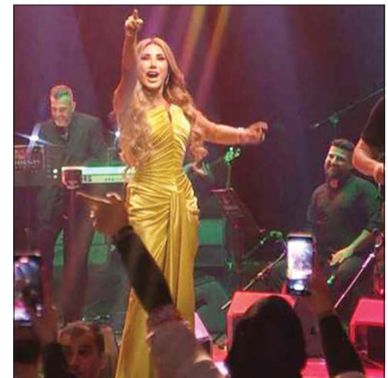
نجوى كرم في الحفل

بيروت: أحييت الفنانة نجوى كرم حفلاً غنائياً في مدينة إسطنبول، على مسرح مركز مؤتمرات «هاليج»، بحضور جمهور متنوع من الحالات العربية المقيمة والزائرة في تركيا. وقدمت كرم خلال الحفل مجموعة من أغنياتها القديمة والجديدة، من بينها أعمال من ألبومها الأخير «حالة طوارئ» التي أسعدت الجمهور وتفاعل معها كثيراً لجماليتها لحنها وكلماتها العذبة.