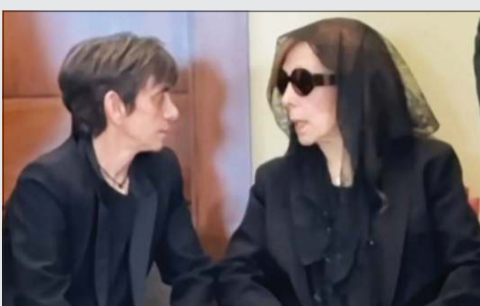
السيدة فيروز في حديث مع ابنتها ريماً خلال اليوم الثاني من عزاء ابنتها زياد

وإذا كانت إحدى الأغنيات الرحبانية الفيروزية تقول «إذا نحنا تفرقنا بجمعنا حبك»، فإن زياد «الحالة الفريدة التي لن يكون لها مثيل» جعل الكل يجتمع على حبه، ويكفي أنه حقق في وادعه حلم كثيرين بأن يلحوا فيروز، ولو أنهم لحوا الأم الحزينة التي اختزلت حزن أمهات الدنيا على خسارة فلذات الأكبدا.