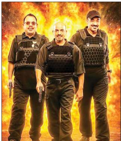
بوستر الخطر معهم