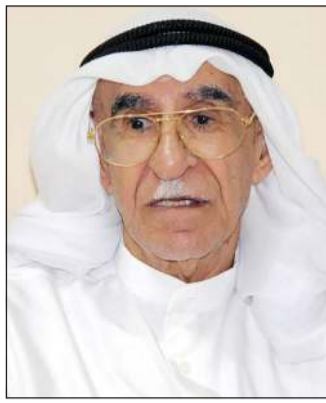
الأديب الراحل فاضل خلف