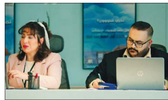
مشهد من فيلم «فتح حساب» يجمع بين فهد وغزلان