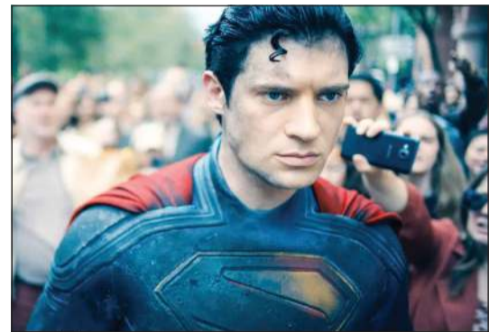
ديفيد كورنيسويت في مشهد من فيلم «سوبرمان»

نيويورك - أ.ف.ب: تصدر الجزء الجديد من فيلم «سوبرمان» ذو الميزانية الضخمة من سلسلة أفلام البطل الخارق الشهير، شبك التذاكر في أميركا الشمالية محققاً إيرادات طائلة بلغت 122 مليون دولار، وفق تقديرات نشرتتها شركة «إكزيبتر ريليتيبنز» المتخصصة. وقال المحلل في شركة «فرنشايز إنترتينمنت ريسيرش» المتخصصة ديفيد غروس إن هذه العائدات تشكل «انطلاقة محلية استثنائية للجزء السابع من قصة مصورة سينمائية لقصص أبطال خارقين منذ أكثر من 75 عاماً».