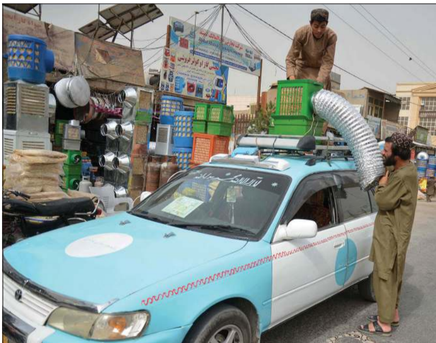
سائق أفغاني يستبدل نظام تبريد أعلى سطح سيارته بإحدى الورش في قندهار

كابول - أ.ف.ب: يعمد سائقو سيارات الأجرة القديمة في أفغانستان، إلى تجهيز أسطح مركباتهم بنظام تبريد يضيخ هواء بارداً داخل السيارات، مما يوفر الراحة للركاب في ظل موجة الحرارة الشديدة في البلاد.