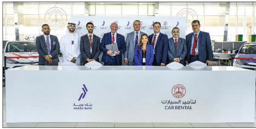
جانب من حفل توقيع الشراكة الإستراتيجية بين بنك وربة وشركة الساير لتأجير السيارات

في إطار إستراتيجيته لتقديم حلول تمويلية مبتكرة وقيمة مضافة لعملائه، أعلن بنك وربة عن إطلاق برنامج الحصري لتأجير سيارات تويوتا بالتعاون مع شركة الساير لتأجير السيارات، حيث يتيح للعملاء فرصة استئجار سيارات تويوتا المختارة ضمن سياسة تمويل مرنة ومرحة، مع مجموعة واسعة من المزايا المصممة لتلبية احتياجاتهم اليومية.