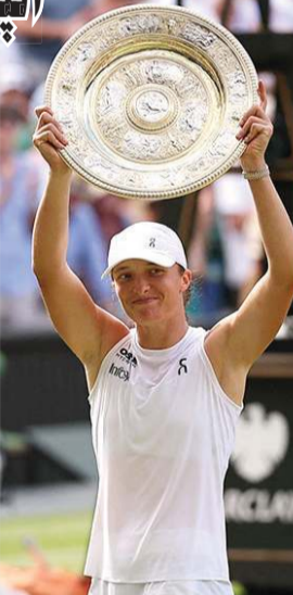
إيفا شفيونتيك تفوز بلقب ويمبلدون

نحتت لاعبة التنس البولندية إيفا شفيونتيك، الرابعة عالميا، في الفوز بلقب بطولة ويمبلدون، ثالثة البطولات الأربع الكبرى لأول مرة في تاريخها، وذلك بعد فوزها في المباراة النهائية على الأميركية أماندا أنيسيموفا بمجموعتين دون رد، وبنتيجة 0-6 و0-6، وهي أول مباراة في تاريخ «غراند سلام» تنتهي دون فوز «الخاسر» بأي شوط. وتخلصت شفيونتيك من عقبتها على الملاعب العشبية وفازت بلقبها الكبير السادس، بعدما فرضت سيطرتها المطلقة على المباراة النهائية. ولم تمكن منافستها أماندا من الفوز بشوط واحد في المجموعتين. ولم يسبق للبولندية - البالغة 24 عاما - أن ذهبت أبعد من ربع النهائي في بطولة ويمبلدون، وكان ذلك مرة واحدة فقط عام 2023 حين أنتهت المغامرة على يد الأوكرانية إيلينا سفيولينا. لكن وبعد الدفع المعنوي الذي حصلت عليه شفيونتيك قبل ويمبلدون بوصولها إلى النهائي الأول لها على العشب، حيث خسرت أمام الأميركية جيسكا بيفولا في دورة باد هامبورغ الألمانية (500 نقطة)، بدا أن شفيونتيك تحررت من العقدة وأثبتت ذلك حين اكتسحت السويسرية بيليندا بنتشيتش 2-6 و0-6 في نصف النهائي، لتصبح أول بولندية تفوز باللقب.