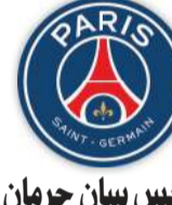
باريس سان جرمان