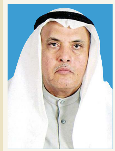
بقلم: د. يعقوب يوسف الفخيم

لدينا نحن المسلمين—وعند من الله غير وعده لليهود الذي سقط لعدم امتثالهم للأوامر الإلهية إى بلآء أشد من هذا الذي تعانیه أمتنا من بني إسرائيل ومن يقف وراءهم منذ بدأت حرب فلسطين الأولى وكانت حرباً مدعومة من الغرب مادياً ومعنوياً بصورة لا تقبل الشك على الرغم من هذا الظلام الدامس المخيم علينا جراء العدوان والغباء الذي تثيره هذه الحرب الغاشمة نتيجة للهجوم الإسرائيلي على أهلنا في فلسطين وقد اتسعت آثاره حتى شملت سورية ولبنان فإن لنا وعداً هو أصق من الوعد الذي يتمسك به المعتدي مرتت بمجموعة من محلات بيع الكتب في الكويت ورايت فيها كتباً تسيء إلى ديننا وتاريخنا ويؤثر ما فيها على حاضرنا وعلى مستقبلنا دون أن يشعر أصحاب هذه المكتبات بعظم الخطأ الذي يقومون به تبيين الباحث والمقارن بين أحداث التاريخ أن كل ما ورد في هذه الكتب وأمثالها منذ كتاب ولغفنون الذي صدر في سنة 1927 وكتاب مونتغمري المطبوع في سنة 1936 إنما قصد به دعم اليهود في دعواهم ثم في حربهم الغاشمة ضد الأمة الإسلامية والعربية. تؤكد البيولوجيا ونبئت التاريخ أن يهود اليوم هم كالتاسم جميعاً نتاج اختلاط وامتزاج شعوب متعددة ولا يمكنهم إبداء المطالبة بإرث أسلاف وهميين واستبعاد السكان