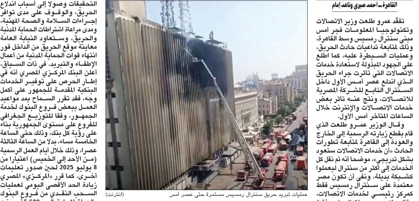
عمليات تبريد حريق سنترال رمسيس مستمرة حتى عصر أمس

في بيان أنها تلقت إخطاراً من قسم شرطة الأزبكية بنشوب حريق هائل بمدينة سنترال رمسيس التابع للشركة المصرية للاتصالات، وانتقل المحامي العام لنيابة شمال القاهرة الكلية، يرافقه فريق من أعضاء النيابة العامة، لإجراء المعاينة لموقع الحادث من الخارج. وتبين من المعاينة الأولية - بحسب بيان النيابة - نشوب الحريق بالمبنى الرئيسي لسنترال، والمكون من أحد عشر طابقاً، وبالمبنى المحقق به المخصص للاتصالات الدولية، والمكون من 6 طوابق. كما انتقل فريق آخر من أعضاء النيابة العامة إلى المستشفيات المحيطة بمكان الحادث لسماع أقوال من أمكن سؤالهم من المصابين، والبالغ عددهم حتى الآن 21 مصاباً. وقد نظرت النيابة العامة جثامين 4 متوفين، ونبنت مصلحة الطب الشرعي لتوقيع الكشف الظاهري عليهم، لبيان أسباب الوفاة للوقوف على جميع ملابسات حادث سنترال رمسيس ونقل الحقائق كاملة للرأي العام. المخصص للاتصالات الدولية، والمكون من 6 طوابق. كما انتقل فريق آخر من أعضاء النيابة العامة إلى المستشفيات المحيطة بمكان الحادث لسماع أقوال من أمكن سؤالهم من المصابين، والبالغ عددهم حتى الآن 21 مصاباً. وقد نظرت النيابة العامة جثامين 4 متوفين، ونبنت مصلحة الطب الشرعي لتوقيع الكشف الظاهري عليهم، لبيان أسباب الوفاة للوقوف على جميع ملابسات حادث سنترال رمسيس ونقل الحقائق كاملة للرأي العام.