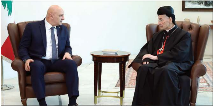
رئيس الجمهورية العماد جوزف عون مستقبلاً بطيريك الماروني الكاردينال بشارة الراعي (محمود الطويل)

يزور رئيس الجمهورية العماد جوزف عون اليوم الأربعاء جزيرة قبرص، حيث يلتقي رئيسها نيكوس خريستودوليس، الذي سبق له أن زار لبنان مهتماً رئيس الجمهورية مباشرة بعد انتخابه في 9 يناير الماضي. في حين انشغل الداخل اللبناني بتقصي نتائج زيارة المفوض الأميركي توماس باراك إلى بيروت، التي أمضى فيها يوماً ثانياً التقى فيه عدداً من الشخصيات السياسية في مقر السفارة الأميركية بوعكر، وهو قصد الجزيرة، حيث التقى قائد الجيش العماد ودولف هيلك وترافقه السفيرة ليزا جونسون، وتكرت زيارة باراك انطباعات إيجابية حرص على إشاعتها بنفسه في تصريحه الرسمي من القصر الجمهوري ببيروت، وبيد أن لبنان الرسمي احتوى أي تداعيات سلبية كان يمكن أن تحصل، بالتركيز على التزام اتفاق وقف إطلاق النار الموقع مع إسرائيل في 27 نوفمبر 2024 بشكل كامل، والمضي في تنفيذه، لجهة الانتهاء من إزالة السلاح غير الشرعي وكل المظاهر المسلحة جنوب الليطاني، ومنع أي عمل عدائي من الجانب اللبناني تجاه الجانب الإسرائيلي، وصولاً إلى التأكيد على المضي في تنفيذ بقية بنود القرار 1701، لجهة حصر السلاح بيد الدولة اللبنانية. وفي المقابل، سأل الجانب اللبناني عن مصير الاتفاق تحديداً من قبل الجانب الإسرائيلي، ووجه السؤال إلى إحدى الدولتين الراعيتين للاتفاق، الولايات المتحدة الأميركية، ويتنظر الجواب الذي قال براك أنه سيتم إعطاؤه عبر السفارة الأميركية في بيروت لاحقاً، وفي ضوء الجواب، يتحدد مسار الأمور، لجهة المضي في الإيجابيات، أو استمرار السلبية الإسرائيلية بمواصلة إسرائيل