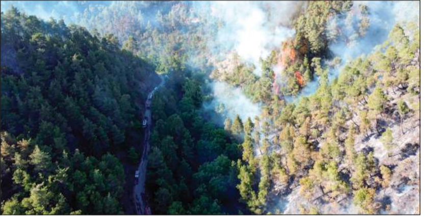
تصاعد النيران جراء حرائق الساحل السوري (سانا)

دمشق تستنجد بالاتحاد الأوروبي لإخماد حرائق اللاذقية.. وتحذيرات من تفاقم الكارثة