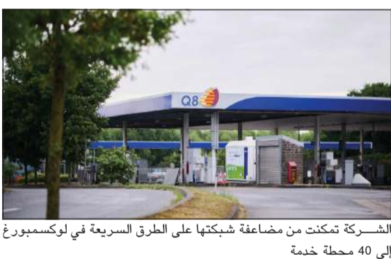
الشركة تمكنت من مضاعفة شبكتها على الطرق السريعة في لوكسمبورغ إلى 40 محطة خدمة

لتحقيق أهدافها في الابتكار والتنمية المستدامة. وأقيم يوم حفل رسمي للاحتفال ببداية العمليات التشغيلية في محطتي بيرشيم بحضور مسؤولين حكوميين قدمهم وزير الاقتصاد والمؤسسات الصغيرة والمتوسطة والطاقة والسياحة في لوكسمبورغ ليكس ديليس وشركاء تجاريين وإدارة الشركة إضافة إلى سفيرنا لدى مملكة بلجيكا ودوقية لوكسمبورغ ورئيس بعثتها لدى الاتحاد الأوروبي وحلف شمال الأطلسي نواف العنزي. وأشار البيان إلى أن المسؤولين أكدوا في كلماتهم خلال الاحتفالية دعمهم لهذه الخطوة الاستراتيجية، مشددين على أهمية التعاون الاقتصادي بين دولة الكويت ولوكسمبورغ لتعزيز التنمية المستدامة وخدمة حركة النقل والطاقة في أوروبا.