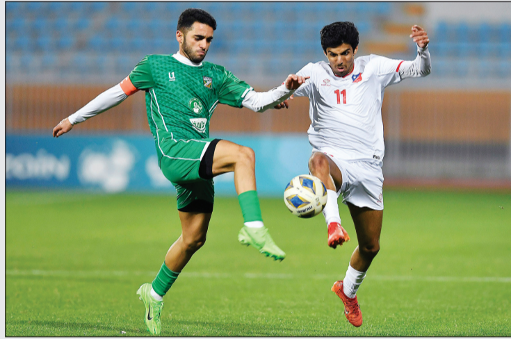
جانب من مباراة العربي والكويت في مسابقة دوري بلو

وأضاف انه لم تكن هناك رقابة حقيقية على الأعمار، وشاهدنا لاعبين كباراً في السن يشاركون دون أي فائدة مستقبلية، كما أن غياب الحوافز الموجهة للأندية التي تطور اللاعبين أضعف من جدية التجربة.