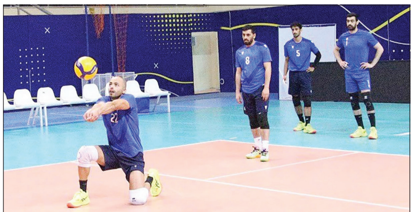
جانب من تدريب سابق للمنتخب الوطني للطائرة

الأحد 20 من الشهر نفسه في الـ 1 ظهرًا، ويختتم مشواره بمواجهة المنتخب القطري الإثنين 21 الجاري في الـ 5 مساءً، وكان منتخبنا قد توجه إلى تونس لإقامة معسكر تدريبي بقيادة المدرب الأرجنتيني جوليان الفارين، وسيلعب عدة مباريات تحضيرية للوصول إلى الجاهزية المطلوبة للمشاركة في البطولة المنتظرة.