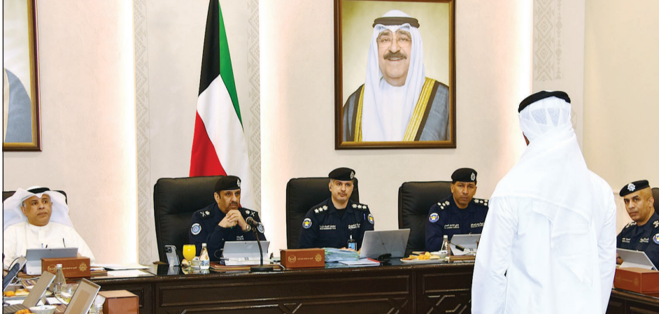
لجنة المقابلات تناور أحد المتقدمين

بدأت وزارة الداخلية بإجراء المقابلات الشخصية للمتقدمين لالتحاق بدورات الطلبة الضباط في أكاديمية سعد العبدالله للعلوم الأمنية، إضافة إلى الأكاديميات الشرطة بدول مجلس التعاون الخليجي، وذلك في مقر الأكاديمية.