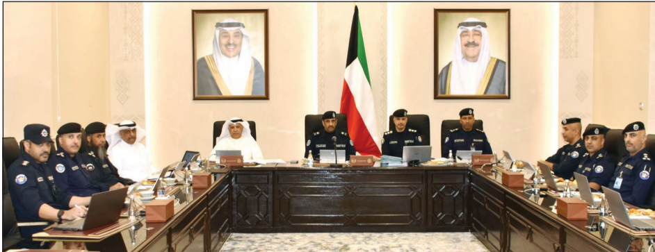
وكيل وزارة الداخلية بالتكليف اللواء علي مسفر العدواني مترأسا لجنة المقابلات