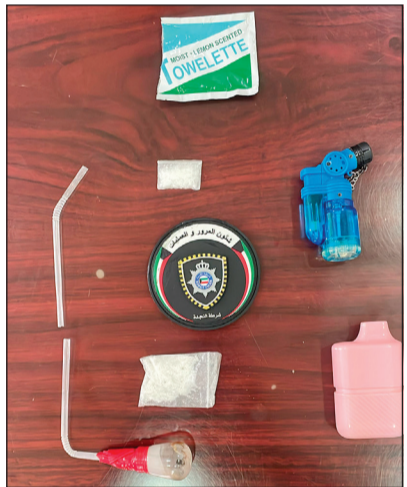
المضبوطات أحييت إلى «المكافحة»

بهما مادة شبو وأدوات التعاطي. من جهة أخرى، ألقى رجال نجدة مبارك الكبير القبض على وافد من مواليد 1970 على خلفية توقيفه لتحرير مخالفة أمن ومناثة، وتبين لرجال النجدة أنه بحالة غير طبيعية، وبتفتيشه عثر بحوزته على كيس كيميالك.