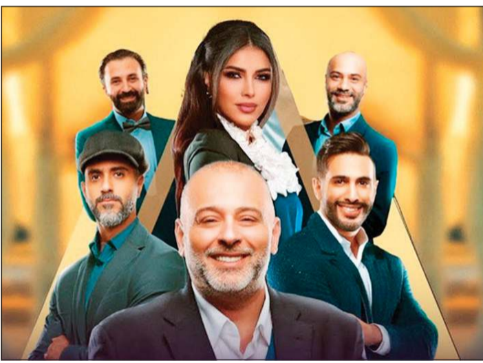
بوستر «مسكون ليلي»

ما رأيك في تجربة صديقك لنجم عبدالعزيز النصار بمسرحية «عيال ابليس»؟ ● ناجحة، الله يوفقه، وعزير فخر لنا جميعاً قروب البلام، وسعيد بوصوله لرقم 200 عرضاً، وأن شاء الله يحقق 500 عرض، وأنا شاهدت المسرحية واستمتعت جداً بها.