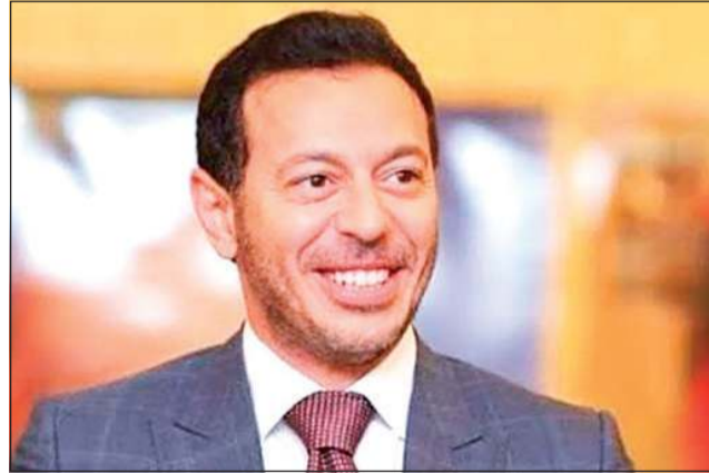
القاهرة - محمد صلاح

اضطر صناع فيلم «مملكة» بطولة الفنان مصطفى شعبان والفنانة هيفاء وهي لتأجيل تصوير أول مشاهد العمل بسبب انشغال المخرج أحمد عبدالوهاب بتصوير الجزء الأول من مسلسل «ابن النصابة». ويقدم مصطفى شعبان خلال العمل شخصية نصاب محترف ينفذ عملية احتيال كبرى تجبره على الهروب خارج مصر، وتحديداً إلى المجر، حيث تبدأ مطاردات وأحداث مشوقة في إطار كوميدي، أما هيفاء وهي، فتؤدي شخصية «النصابة الذئ» التي تدخل في صراع مباشر معه، لتنشأ بينهما مواجهة قوية تعتمد على الذكاء والمكر.