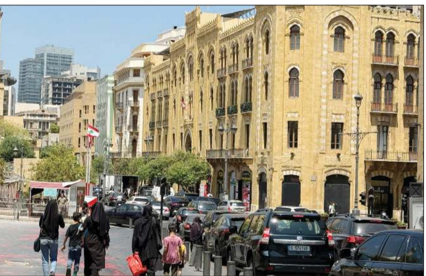
حركة سياحية في منطقة أسواق بيروت بوسط العاصمة

توازيًا، ارتفعت أصوات طالبت «الحزب» بوقف الأنشطة العسكرية على الأرض، في ضوء الرصد الإسرائيلي الدقيق، والاستهداف اليومي لأفراد «الحزب». وفي هذا الوقت تبقى العين على ساحة النجمة، حيث يعقد المجلس النيابي اليوم جلسة تشريعية، وعلى جدول الأعمال عدة مشاريع قوانين حيوية تتعلق بالإقرار، منها الموافقة على اتفاقتي قرض مع البنك الدولي للإنشاء والتعمير، إضافة إلى إقرار منح شهرية للعسكريين، وبالتالي فإن أي عرقلة للجلسة نتيجتها الخلافات حول قانون الانتخاب وتعديلاته ستكون تداعياتها سلبية. ولم يخف قسم كبير من النواب المنتخبين إلى كتل سياسية أو أفراد منهم، رغبتهم في إثارة موضوع تكثيف المغتربين من الاقتراع للثواب الانتخابي وسجل نفوسه. ويتوقع تحريك هذه المسألة لتمير جلسة اليوم، في ضوء أمور ملحة تتقدم على غيرها في هذه المرحلة.