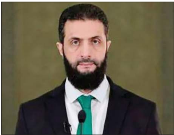
الرئيس السوري أحمد الشرع

المكونات السورية والانفتاح على الغرب، مشيراً إلى أن فصائل مسلحة قد تسعى إلى اغتياله لعرقلة المسار السياسي الجديد في البلاد. وفي مقابلة مع موقع «المونيتور»، قال باراك إن إدارة الرئيس الأميركي دونالد ترامب، «قلقة من أن يصبح الرئيس الشرع هدفاً لاغتيال محتمل من قبل ساخطين»، داعياً إلى «تنسيق منظومة حماية» حول الرئيس الشرع، مشدداً على أن الرد يجب أن يكون عبر تبادل المعلومات الاستخباراتية مع الحلفاء، وليس من خلال تدخل عسكري. وأشار باراك إلى أن بعض الفصائل المتشقة من المقاتلين الأجانب الذين قاتلوا مع الشرع في الحملة الخاطفة التي أطاحت بنظام الرئيس المخلوع بشار الأسد، تحاول جذب هؤلاء إلى صفوف تنظيمات مثل «داعش»، مضفاً أنه «كلما تأخرنا في تحقيق الإغاثة الاقتصادية زادت فرص الجماعات المسلحة لتعطيل المسار».