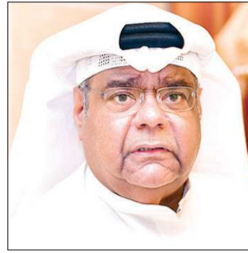
الملحن أنور عبدالله