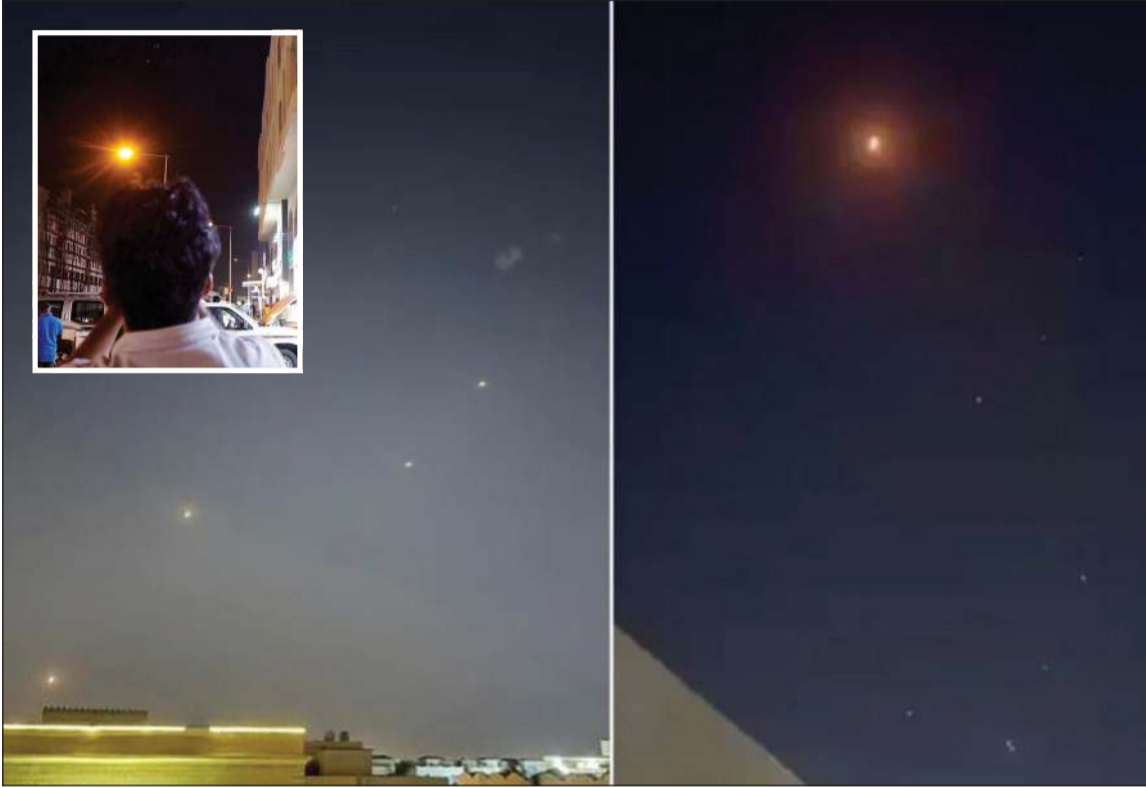
صور تداولتها مواقع التواصل لصواريخ إيرانية في سماء قطر.. وفي الإطار أشخاص يلتقطون صوراً لمقذوفات فوق الدوحة

ولاحقاً، أكدت وزارة الداخلية القطرية أن الأوضاع الأمنية في قطر مستقرة ولا يوجد ما يدعو للقلق. وقالت الوزارة، في بيان، إنه «انطلاقاً من مسؤوليتها في الحفاظ على أمن المجتمع وسلامة المواطنين (القطريين) والمقيمين، فإنها تؤكد أن الأوضاع الأمنية في قطر مستقرة ولا يوجد ما يدعو إلى القلق».