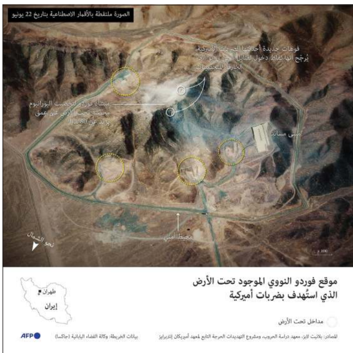
الصورة ملتقطة بالأقمار الاصطناعية بتاريخ 22 يونيو

قوات جوية إسرائيلية تقصف سجن «إيفين» في طهران، إيران