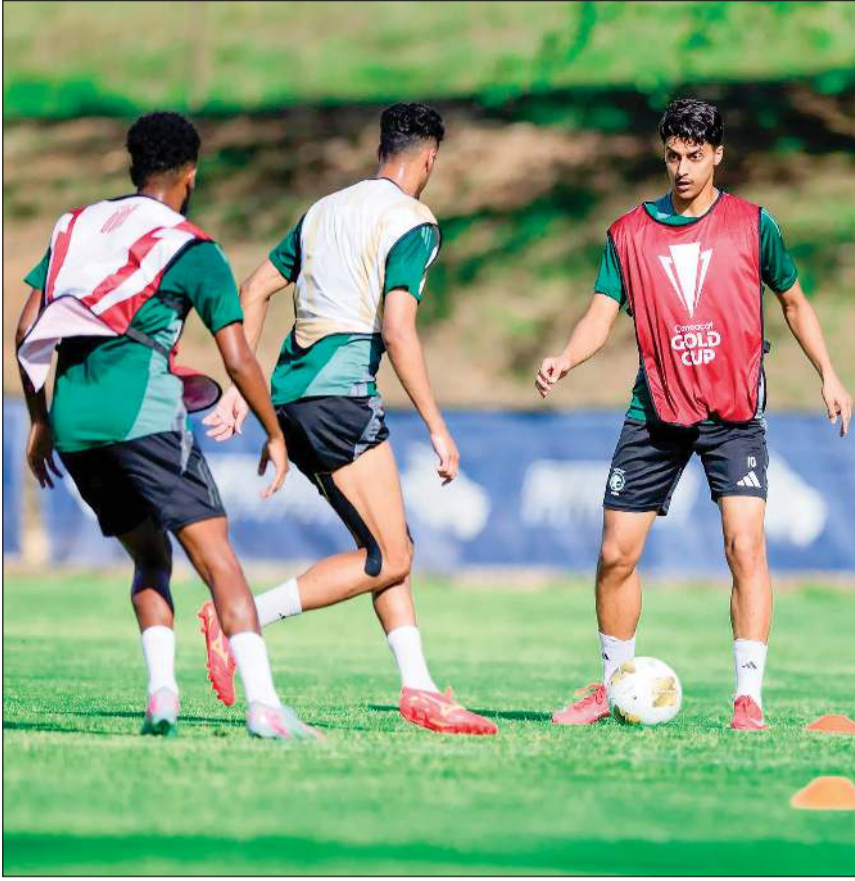
جانب من تدريبات «الأخضر السعودي» لمواجهة ترينيداد وتوباغو

التأهل إلى ربع النهائي. وأضاف: «كانت لدينا فرصة في الشوط الأول، لكن لم تكن فاعلين بما يكفي. علينا أن نتطور في الحسم الهجومي، فالسعودية تملك مهاجماً واحداً فقط ينشط في الدوري المحلي»، وتابع: «لعبنا أمام منتخب يحتل المركز 16 في التصنيف العالمي، ولم يكن له سوى فرصة من ركنية وهدف من كرة ثابتة. وهنأت اللاعبين بعد المباراة على الأداء». وأشار رينارد إلى أن الغيابات أثرت على الفريق، قائلاً: «كلا الفريقين عانى من الغيابات، لكن لدينا 8 لاعبين غائبين. اللاعبون احترموا الخطة التكتيكية، وامتلكنا 3 فرص حقيقية لو استغلنا لتغيرت النتيجة». وعن لقاء ترينيداد وتوباغو، قال رينارد: «ستكون مباراة مختلفة. علينا أن نحافظ على الكرة وأن نكون مستعدين. التأهل إلى ربع النهائي هدفنا. لكن لاعبي ترينيداد وتوباغو سيلعبون من أجل الهدف ذاته، بعد تعادلهم الأخير».