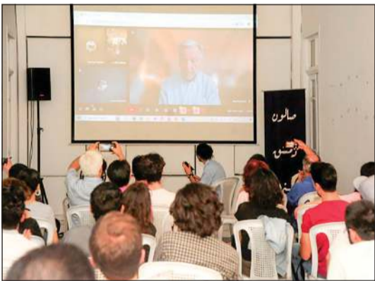
جانب من صالون دمشق السينمائي