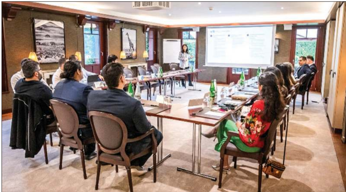
جانب من إحدى الحلقات النقاشية

السبل الكفيلة التي تساعده على تعزيز حضوره في أوساط العملاء المميزين وإرضائهم والارتقاء بمكانته التنافسية في القطاع المصرفي، فضلا عن التوسع بالخدمات والحلول التي يتم توفيرها وفق أعلى المستويات العالمية. وذكر أن إقامة المنتدى تؤكد في الوقت نفسه على الاهتمام الكبير الذي يولييه البنك الأهلي الكويتي من أجل التفاعل بشكل أكبر مع العملاء، مما يسهم في نجاحه بتنفيذ خطته الإستراتيجية بأفضل صورة ممكنة، مشدداً على الأهمية الكبيرة لقطاع الثروات الشخصية في دولة الكويت والمنطقة والعالم وهو ما يظهر من خلال الارتفاع المتواصل في حجم الثروات الشخصية بحسب العديد من الإحصائيات العالمية في هذا الخصوص، ومن بينها توقعات شركة بوسطن كونسلتنغ غروب للاستشارات (BCG) التي تقدر بأن ترتفع الثروة المالية في دولة الكويت إلى ما يقرب من 400 مليار دولار أميركي بحلول عام 2026 بمعدل نمو مركب يبلغ 4,3٪ منذ عام 2021، ونمو الثروة المالية لدول مجلس التعاون الخليجي بنسبة 4,7٪ بحلول عام 2027 لتصل إلى 3,5 تريليونات دولار أميركي. وتابع القطان أن البنك الأهلي الكويتي سيحرص أيضا على تقديم المزيد من الخدمات المصرفية الخاصة للعملاء المميزين، ومن بينها الخدمات والحلول العقارية التي تشهد طلبا كبيرا من قبلهم سواء في دولة الكويت أو في الدول الأخرى التي يعمل بها البنك.