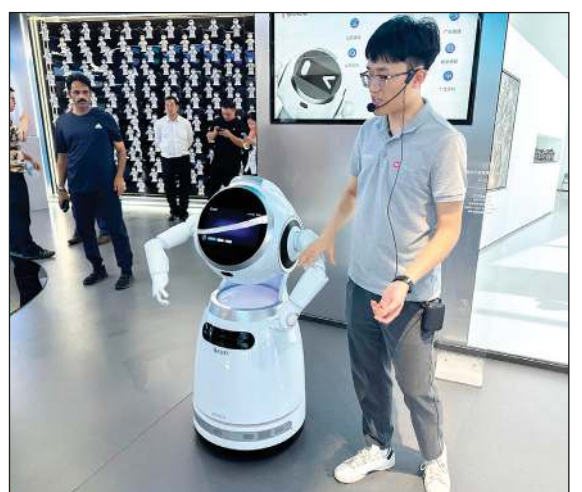
الاعتماد على تكنولوجيا الروبوتات يتزايد