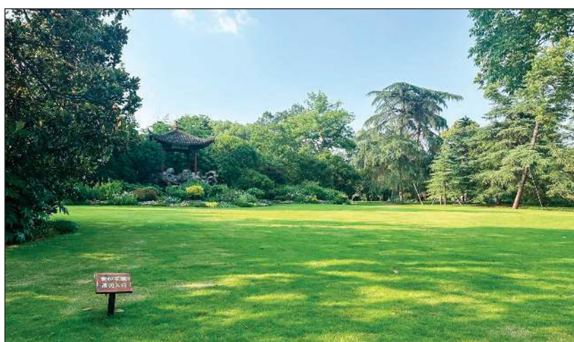
اللون الاخضر يبعث في النفس راحة وطمانينة