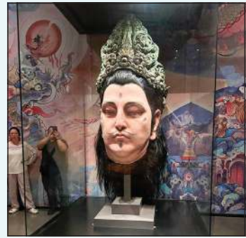
داخل أحد المتاحف