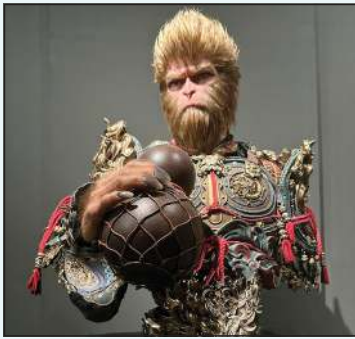
تجسيد لقصة بلاك ميث ووكونغ