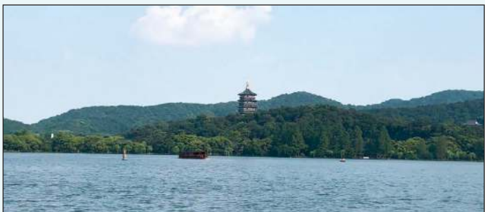
بحيرة الغرب الأسطورية