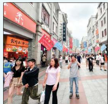
جانب من الشوارع التجارية والشعبية