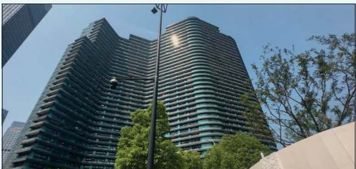
أكبر عمارة في العالم يسكنها 20 ألف شخص