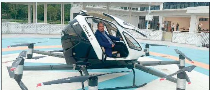
الطائرة الذاتية لنقل البشر عبارة عن مركبة جوية كهربائية