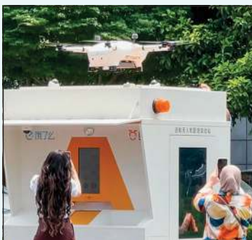
توصيل الطلبات بالطائرة الدرون