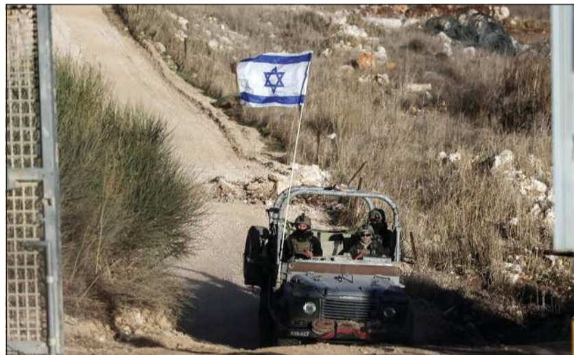
صورة أرشيفية لآلية إسرائيلية متوغلة في المنطقة العازلة في الجولان المحتل

وكالات: كشفت تقارير اعلامية عن عقد محادثات وجهاً لوجه بين سورية وإسرائيل في الأسابيع الأخيرة، بهدف تهدئة التوترات الأمنية ومنع التصعيد في المنطقة العازلة بين الجانبين، ووفقاً لما أفاد به خمسة مصادر مطلعة لوكالة «رويترز». وكشفت هذه الاتصالات عن تحول مهم في طبيعة العلاقة بين الطرفين، خاصة في ظل دعم الولايات المتحدة للحكومة الجديدة في دمشق وتشجيعها على التواصل مع إسرائيل، بالتزامن مع تقليص وتيرة القصف الإسرائيلي داخل سورية، بحسب المصادر.