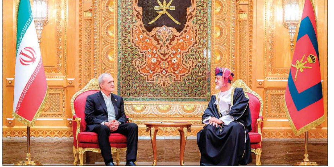
سلطان عمان السلطان هيثم بن طارق مستقبلا الرئيس الإيراني مسعود بزشكيان

عواصم - وكالات: عقد صاحب الجلالة السلطان هيثم بن طارق سلطان عمان والرئيس الإيراني مسعود بزشكيان جلسة مباحثات رسمية بضيافة قصر العلم العام، وفي مستهل الجلسة، جدد سلطان عمان ترحيبه بالرئيس الإيراني والوفد المرافق آملا لهم طيب الإقامة، فيما عبر الرئيس الإيراني عن خالص شكره وتقديره لسلطان عمان على حفاوة الاستقبال وحسن الوفاة. ووفق وكالة الأنباء العمانية جرى خلال الجلسة استعراض عمق العلاقة التاريخية التي تجمع البلدين الصديقين، وتبادل وجهات النظر حول المستجدات الراهنة بالمنطقة والسعي في تعزيز الشراكة العمانية الإيرانية لاسيما في مجالات الصناعة والتجارة والتعليم، إضافة إلى تعزيز التعاون في الأنشطة اللوجستية والصحية بما يخدم مصلحة الشعبين الصديقين. عقب ذلك عقد جلالة السلطان المعظم والرئيس الإيراني جلسة ثنائية خاصة، وكان سلطان عمان السلطان هيثم بن طارق استقبال الرئيس الإيراني مسعود بزشكيان أمس بقصر العلم العام بمناسبة زيارته الرسمية إلى السلطنة وقد أجريت له مراسم استقبال رسمية. هذا وشهد السلطان هيثم بن طارق المعظم والرئيس مسعود بزشكيان، التوقيع