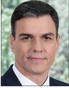
رئيس الوزراء الإسباني بيدرو سانثيز

المجالات، خاصة الاقتصادية والتجارية والاستثمارية بما يتفق مع مصالح الشعبين الصديقين. وأضاف المتحدث الرسمي أن الاتصال تناول الأوضاع في الأرض الفلسطينية، وتناول أيضا الأوضاع في سورية ولبنان وليبيا، حيث تم التأكيد على ضرورة الحفاظ على وحدة هذه الدول الشقيقة وسلامة أراضيها وأمن سكانها، كما تم التأكيد على استمرار التشاور والتنسيق بين مصر وإسبانيا في مختلف الملفات الإقليمية في ضوء الدور المهم الذي يضطلع به البلدان في استعادة الاستقرار الإقليمي.