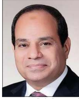
الرئيس عبدالفتاح السيسي

استغلال الرزخ الذي تشهده العلاقات الثنائية بين البلدين والذي تكلم بزيارة الرئيس إلى مدريد في فبراير 2025، وذلك لاستكشاف آفاق أرحب لتعزيز التعاون في مختلف