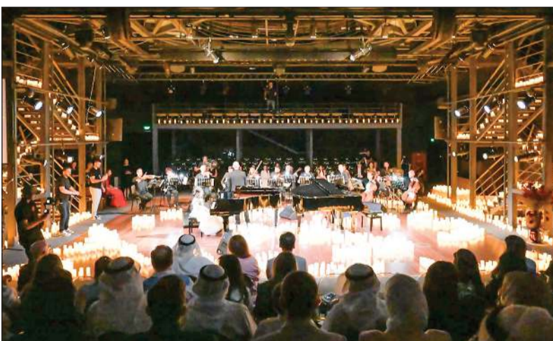
جانب من الأمسية الموسيقية

وتوم جونز بمرافقة أوركسترا متخصصة. تخصص الحفلات الموسيقية الأولى والثاني للعازقين والعازقات من عمر 4 سنوات إلى 13 سنة، وبلغ إجمالي عدد المشاركين 80 عازقا وعازقة، فيما شكلت الحفلة الثالثة البداية الحقيقية لبرنامج «رقصة التانغو من القلب» والتي تميزت بالاحترافية شكلا ومضمونا، حيث تم دمج أفضل 12 عازقا وعازقة محترفين من أكاديمية ليما باكسر مع 15 عازقا وعازقة أوركسترا محترفين من أساتذة الأكاديمية و4 عازقين للبيانو.