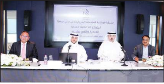
الشيخ صباح محمد عبدالعزيز مترشداً اجتماع الجمعية العمومية لشركة «نابيسكو»

لدى الشركة لرفع الكفاءة التشغيلية والمساهمة في ترسيخ بيئة أعمال أكثر استدامة. واستعرض الصباح إنجازات 2024، قائلاً: «ركزنا خلال 2024 على تعزيز حكمة وتقديم قيمة مستدامة لجميع أصحاب المصالح، وأفمرت جهودنا المشتركة تحقيق نتائج متميزة، عززت من المكانة الريادية للشركة على مستوى قطاع الطاقة، ليشكل 2024 محطة بارزة في مسيرة الشركة، إذ شهد تحقيق إنجازات نوعية».