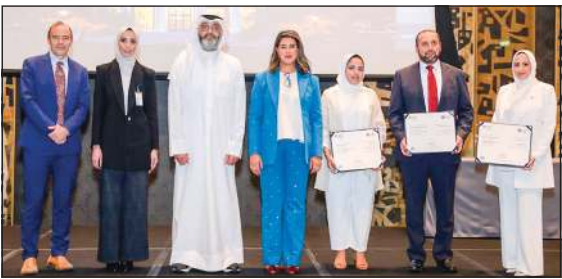
تكريم موظفي «KIB» بعد تخرجهم في برنامج «هارفارد»