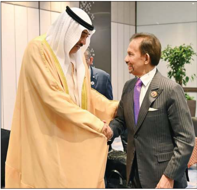
ممثل صاحب السمو الأمير مشعل الأحمد سمو ولي العهد الشيخ صباح خالد مصافحا صاحب الجلالة السلطان الحاج حسن البلقية معز الدين والدولة سلطان بروناي دار السلام