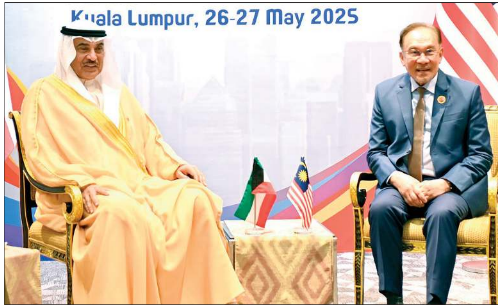
ممثل صاحب السمو الأمير مشعل الأحمد سمو ولي العهد الشيخ صباح خالد مستقبلا رئيس وزراء ماليزيا داتو سيري أنور إبراهيم