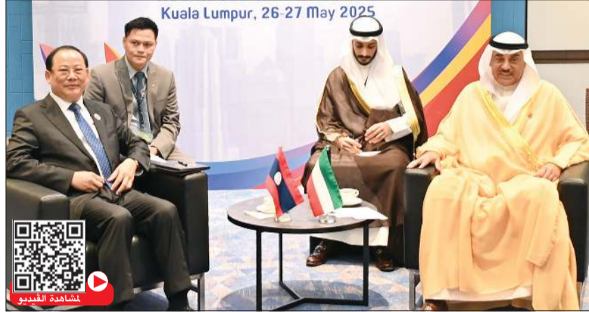
ممثل صاحب السمو الأمير مشعل الأحمد سمو ولي العهد الشيخ صباح خالد مستقبلا رئيس وزراء جمهورية لاوس د. سونيكساي سيفاندون

ولي العهد سناً رئيس جورجيا بذكرى استقلال بلاده بعث سمو ولي العهد الشيخ صباح خالد ببرقية تهنئة إلى الرئيس ميخائيل كافيلاشفيلي رئيس جمهورية جورجيا الصادقة، ضمنها سموه خالص تهانيه بمناسبة تكري الاستقلال لبلاده، راجيا له دوام الصحة والعافية.