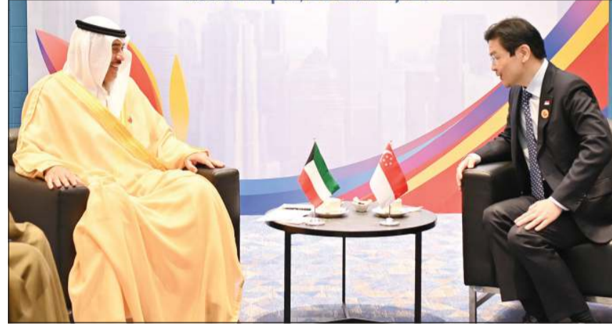
ممثل صاحب السمو الأمير مشعل الأحمد سمو ولي العهد الشيخ صباح خالد مستقبلا رئيس الوزراء ووزير المالية السنغافوري لورنس وونغ

التقى ممثل صاحب السمو الأمير الشيخ مشعل الأحمد سمو ولي العهد الشيخ صباح الخالد داتو سيري أنور إبراهيم رئيس وزراء ماليزيا الصديقة على هامش القمتين الثانية لدول الآسيان ودول مجلس التعاون لدول الخليج العربية ودول الآسيان ودول مجلس التعاون لدول الخليج العربية وجمهورية الصين الشعبية في العاصمة كوالالمبور.